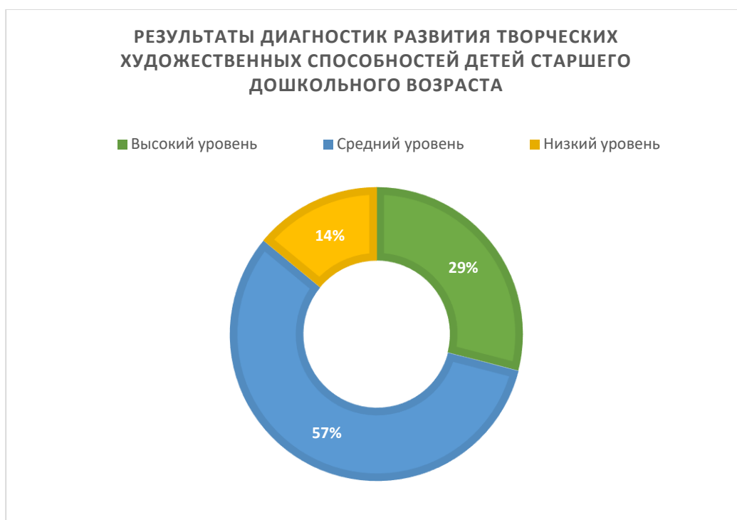
Рис.1 «Результаты диагностик развития творческих художественных способностей детей старшего дошкольного возраста»

Таким образом, мы выявили, что уровень развития творческих художественных способностей детей старшей группы МБДОУ детский сад №301 города Челябинска находится в основном на среднем и низком уровнях.