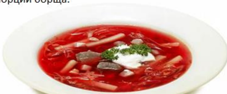
Рисунок 1 – Пример кейс-задания для решения.

20 сентября в ресторане имеются продукты для приготовления борща, в какой последовательности должны идти технологические операции при его приготовлении, какое количество отходов будет при обработке свеклы (г, %) и сколько продуктов весом брутто необходимо для приготовления 5 порций борща.