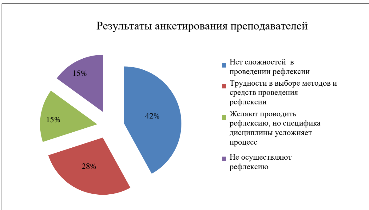
Рисунок 1 – Исследование характера затруднений в проведении рефлексии у преподавателей