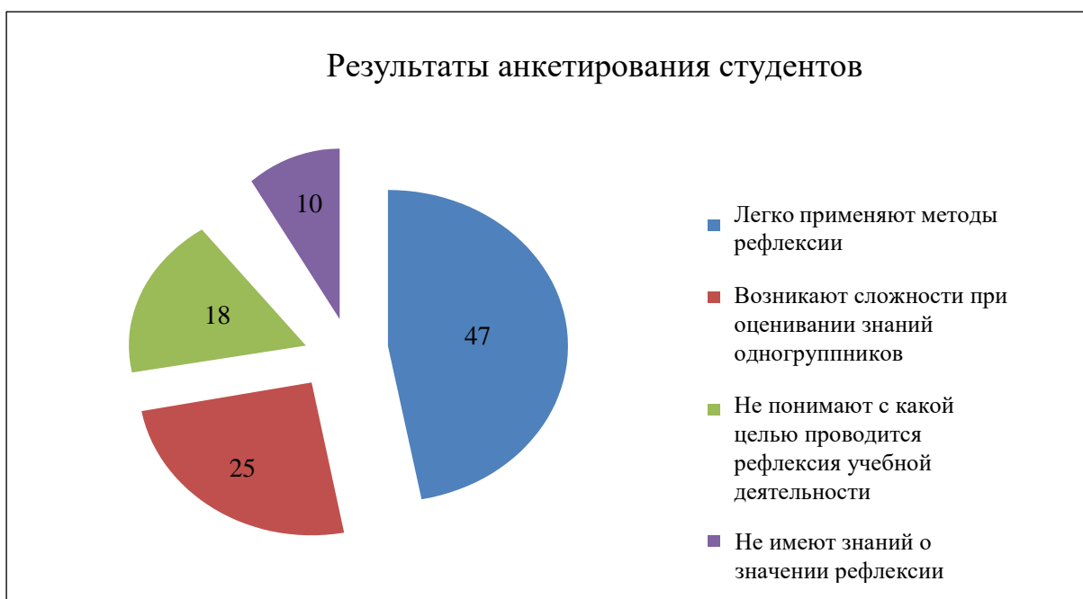
Рисунок 2 – Развитость рефлексивных умений студентов и правильного оценивания собственной учебной деятельности

На основании результатов анкетирования нам удалось выяснить, что большинство студентов группы № ЭК-101, 1 курса, очного отделения, по специальности «Экономика и бухгалтерский учет (по отраслям)», готовы к обучению в колледже, но не обладают умениями объективно оценивать свои достижения. Также, мы определили, какие методы, по мнению обучающихся, наиболее целесообразны на занятиях, и с какими сложностями они сталкиваются при проведении педагогами рефлексии.