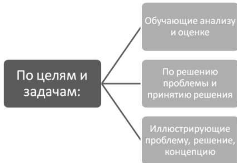
Рисунок 1 – Классификация ситуационных заданий по целям и задачам

Ситуационные задания могут быть классифицированы, исходя из целей и задач процесса обучения. В этом случае могут быть выделены следующие типы ситуационных заданий (рис. 1).