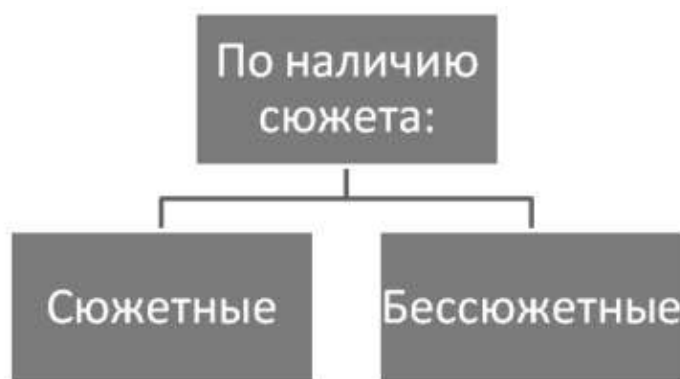
Рисунок 2 – Классификация ситуационных заданий по принципу наличия сюжета

По наличию сюжета ситуационные задания делятся на сюжетные и бессюжетные (рис. 2).