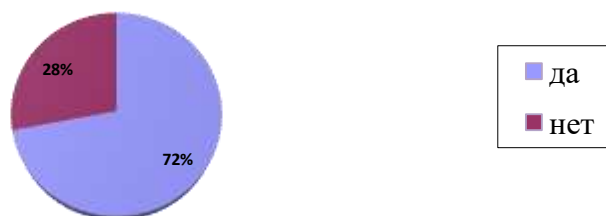
Рисунок 1 - Важность повышения степени правовой культуры по мнению студентов