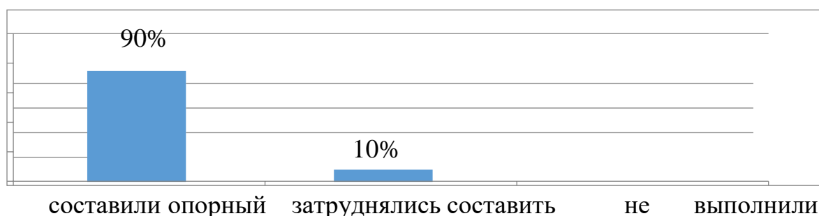
Рис. 2. Продолжение самостоятельного составления студентами опорного конспекта

С данной задачей справились практически все студенты, а именно 90 % (26) студентов группы, лишь 10 % (1) студент не смог спланировать свою деятельность и определить главные блоки. Для этого студента после академической пары был заново объяснен алгоритм выполнения.