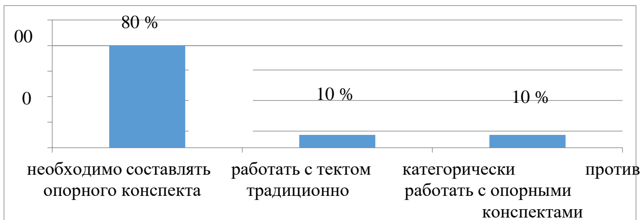
Рис.3. Выявление отношения студентов к самостоятельному составлению опорных конспектов

Данные представлены в виде диаграммы на Рисунке 3.