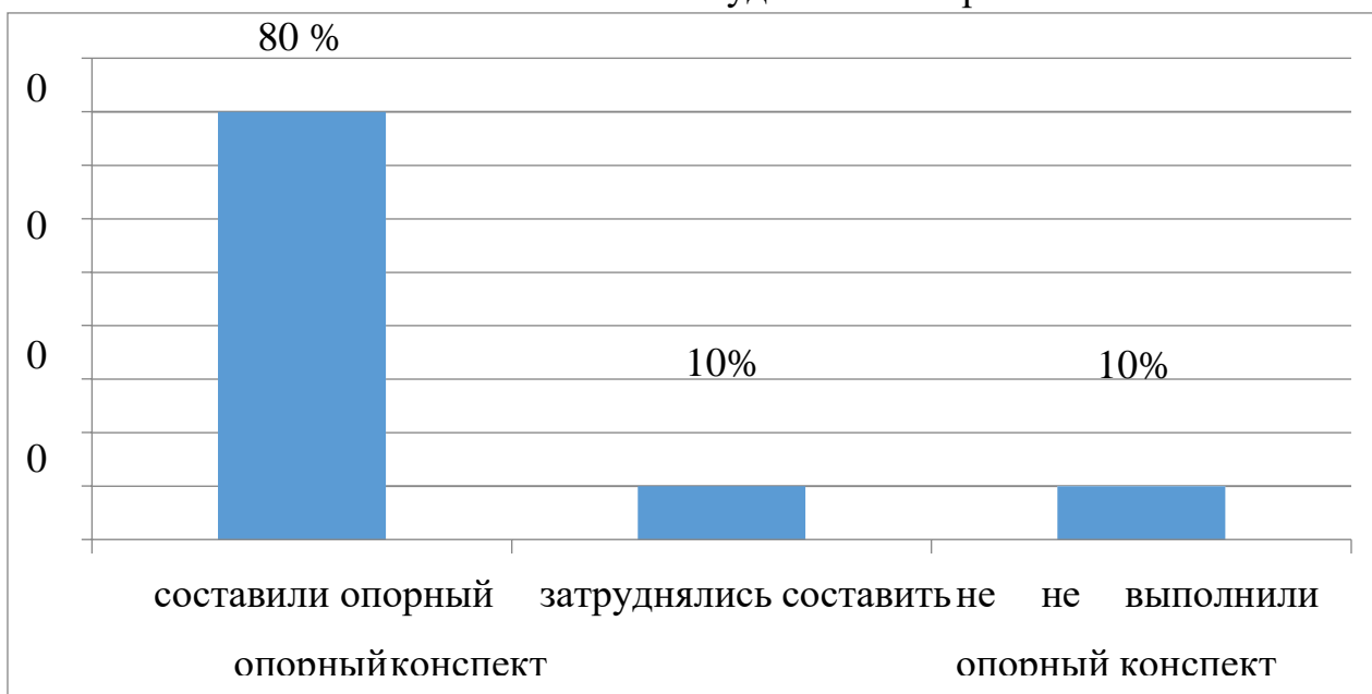
с. 1. Самостоятельное составление студентами опорного конспекта

Большая часть группы, а именно 80 % (21) студентов отлично справились с задачей. Лишь у 10% (3) студентов возникли затруднения, с которыми они справились при помощи одногруппников. 10 % (3) студентов не справились самостоятельно с составлением опорного конспекта.