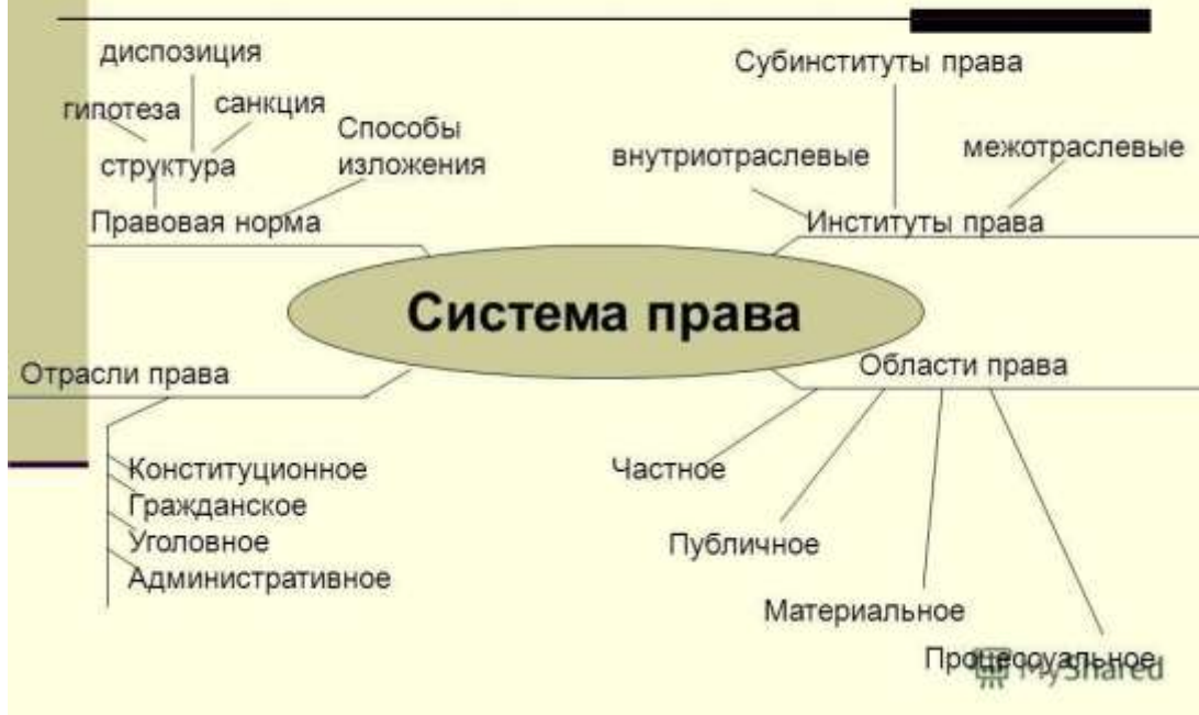
Рис.1. Пример опорного конспекта, применяемого на занятиях в ГАПОУ СМПК при изучении дисциплины «Право».