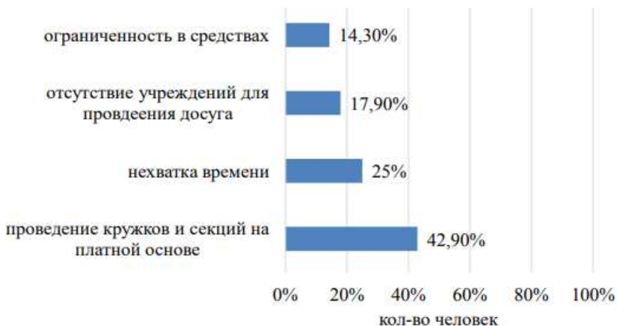
Рисунок 3 – Рейтинг причин отсутствия досуга по результатам опроса

2.2 Рекомендации по совершенствованию индивидуально-профилактической работы по предупреждению административных правонарушений со студентами в ГБОУ СПО (ССУЗ) «Челябинский государственный колледж индустрии питания и торговли»