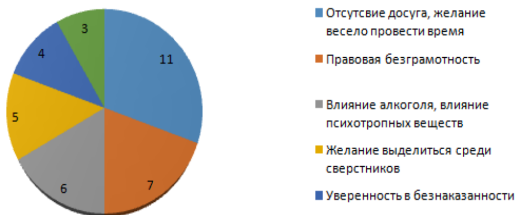
Рисунок 2 – Результаты опроса по причинам правонарушений

Из вышеизложенных результатов введённого опроса, было сформировано мнение, что значительная часть опрошенных, считают, что основной причиной правонарушений среди студентов ГБОУ СПОр (ССУЗ) «Челябинский государственный колледж индустрии питания и торговли» является желание как-то провести весело время при альтернативных вариантах проведения досуга.