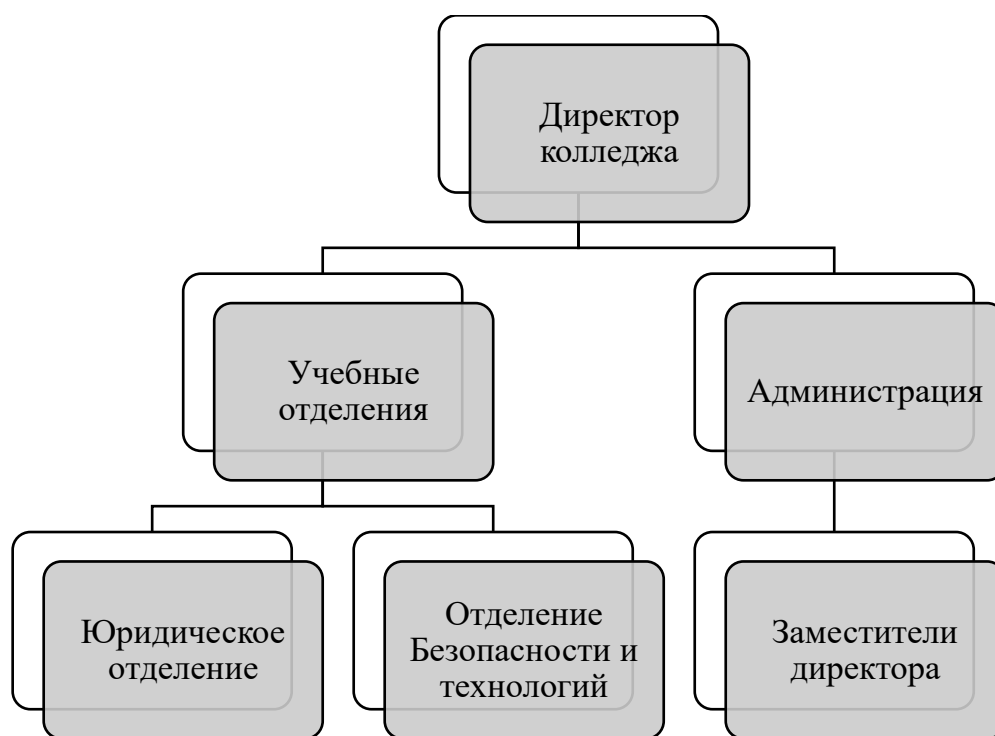
Рисунок 2 – Организационная структура управления Челябинского юридического колледжа

Согласно данным, представленным на рис. 2, все управленческие решения Челябинского юридического колледжа принимает директор образовательного учреждения, который также контролирует деятельность Администрации и Учебных отделений. Но при этом, в каждом отделении есть непосредственный заведующий, который является непосредственным руководителем сотрудников каждого подразделения.