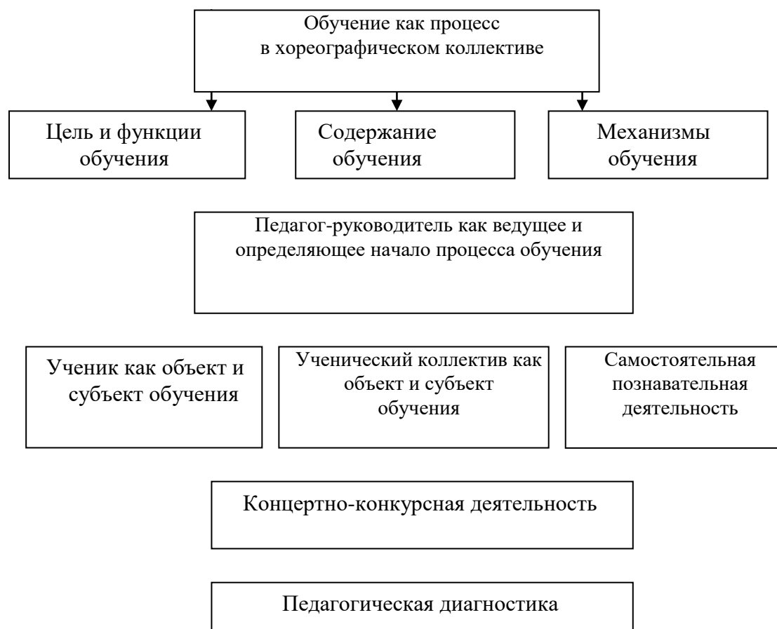
Рисунок 1 – Структура процесса обучения

новыми методами, своевременно уделять внимание отстающим учащимся и добиваться успехов. Таких методов диагностики в дополнительном образовании в области хореографии существует множество. Однако оба индикатора являются самыми простыми и наглядными. Это количество концертно-конкурсных мероприятий и количество учащихся, продолжающих хореографическое обучение в профильных школах и становящихся профессионалами в хореографии.