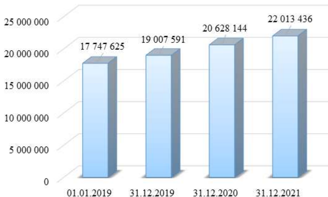
Рисунок 2 – Динамика стоимости активов ПАО «САК «Энергогарант», тыс. руб.

Общая стоимость активов ПАО «САК «Энергогарант» за период 2019-2021 гг. увеличилась на 4 265 811 тыс. руб., что в относительном выражении составляет 24,04%, при этом прирост за 2019 г. составил 7,10%, прирост за 2020 г. – 8,53%, прирост за 2021 г. – 6,72%. Динамика стоимости активов анализируемой страховой компании проиллюстрирована на рисунке 2.