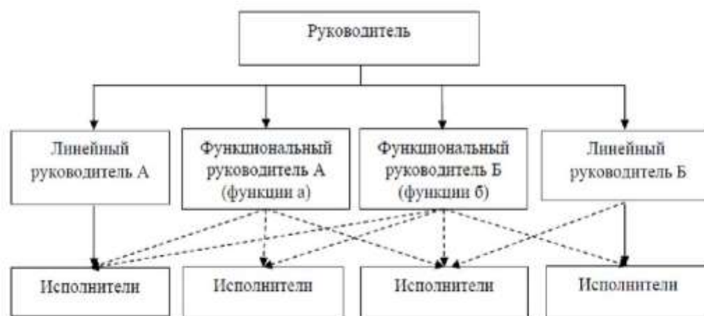
Рисунок 1 – Организационная структура центрального офиса САК «Энергогарант»

Основу линейно-функциональных структур составляет так называемый «шахтный» принцип построения и специализация управленческого процесса по функциональным подсистемам организации (выполнение эксплуатационных мероприятий, снабжение, финансы и т.п.). По каждой из них формируется иерархия служб («шахт»), пронизывающая всю организацию сверху донизу. Результаты работы каждой службы аппарата управления организацией оцениваются показателями, характеризующими выполнение ими своих целей и задач.