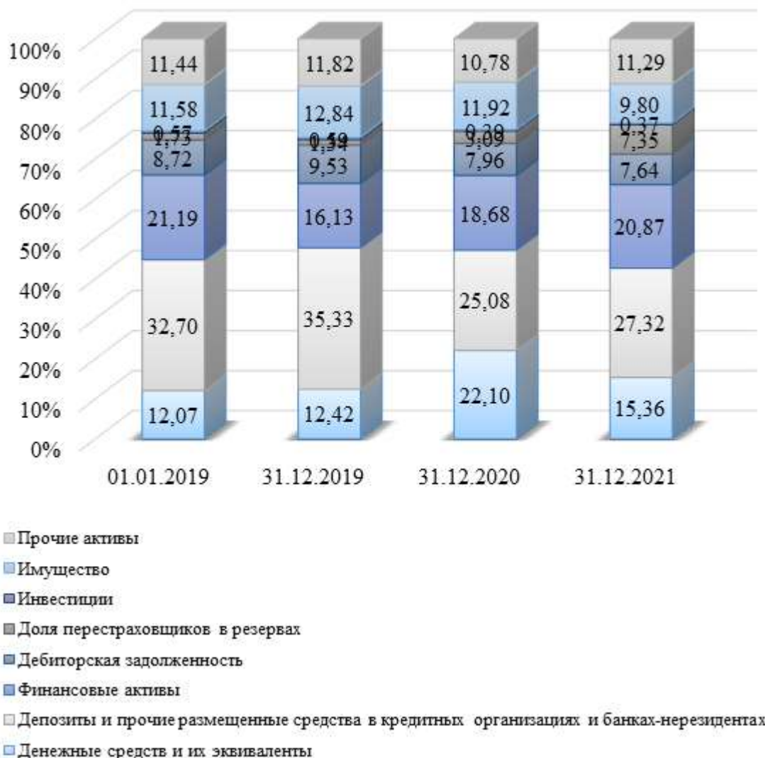
Рисунок 4 – Структура активов ПАО «САК «Энергогарант», %

Структура активов страховой компании проиллюстрирована на рисунке 4.