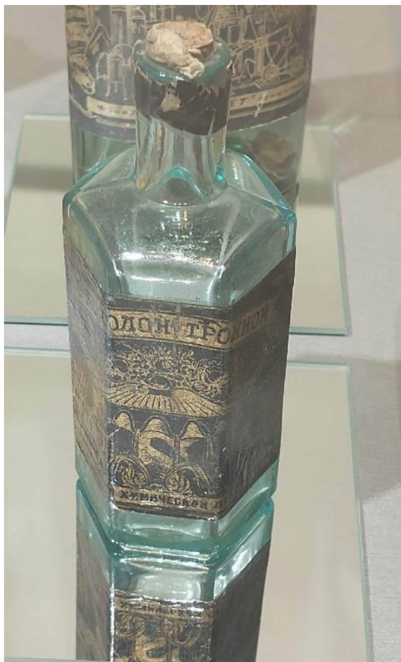
Иллюстрация 15.Одеколон «Тройной». «Северное сияние». г. Ленинград. 1920-е гг. 122