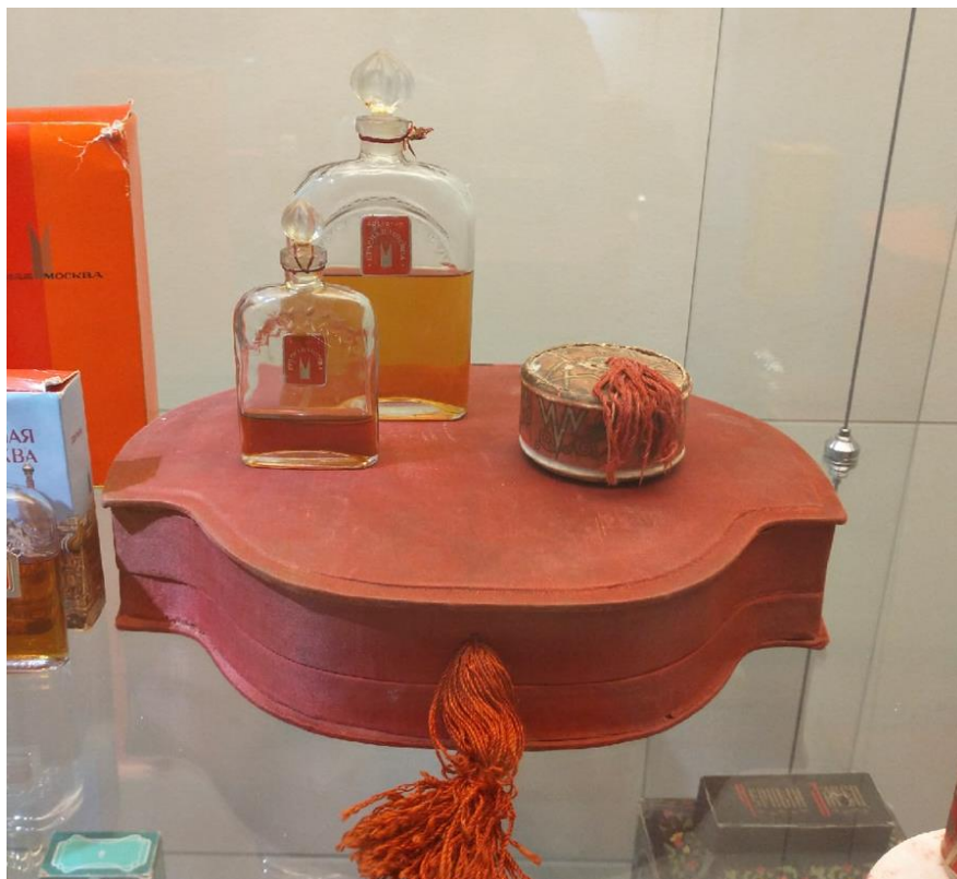
Иллюстрация 9. Коробка сюрпризная «Красная Москва», 1930-е гг. 116