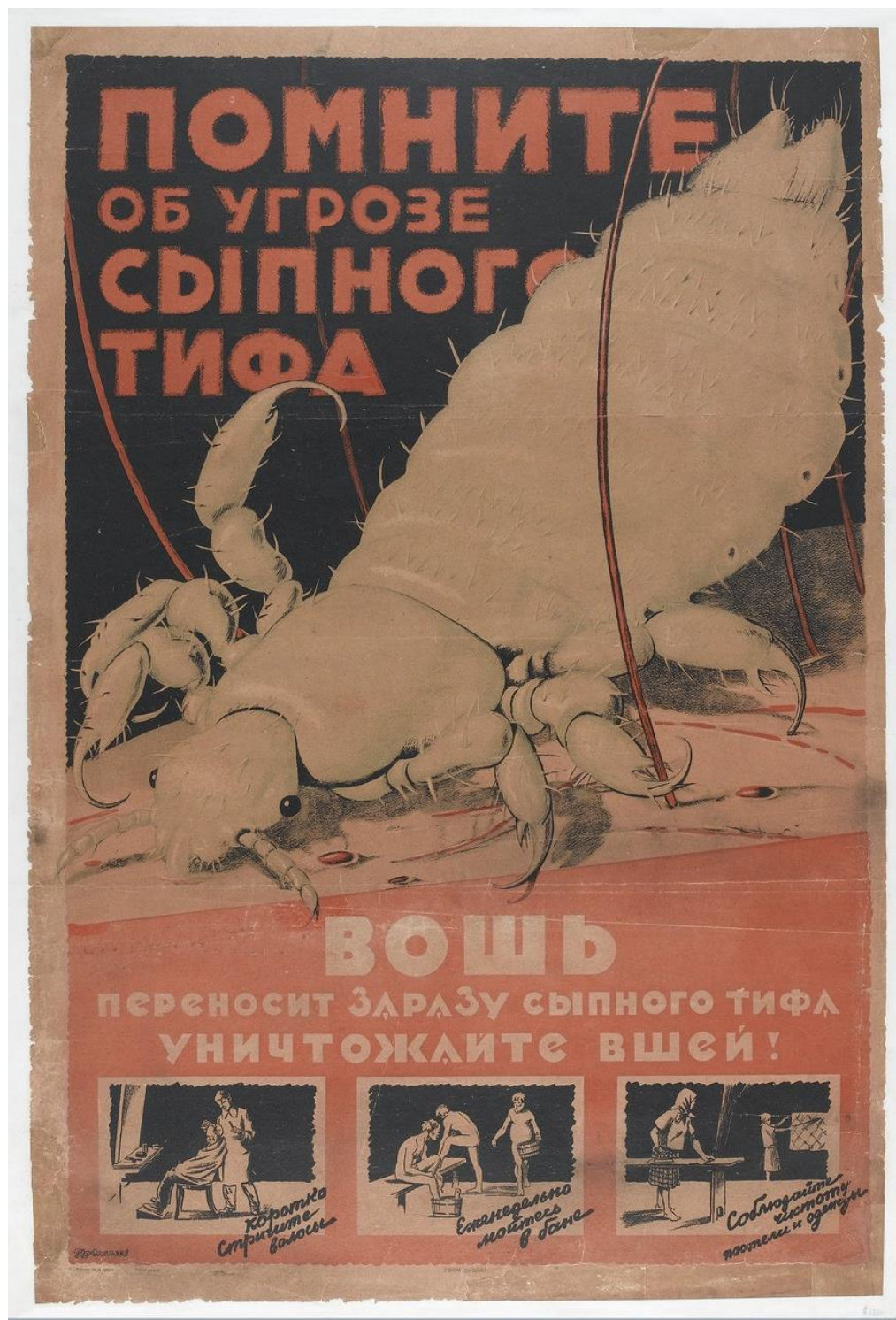
Иллюстрация 8. Плакат. Художник В. Казначеев. Начало 20-х гг. Помните об угрозе сыпного тифа. 115