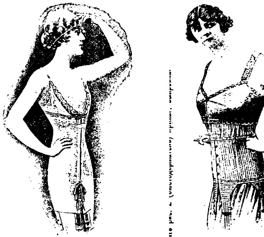
Иллюстрация 7. Корсеты 1910-х годов. 114