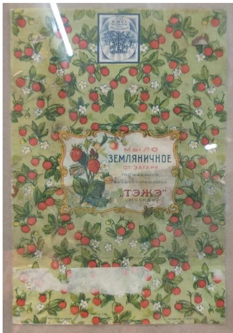
Иллюстрация 11. Мыло «Земляничное». ТЭЖЭ. 1920–1930-е гг. 118