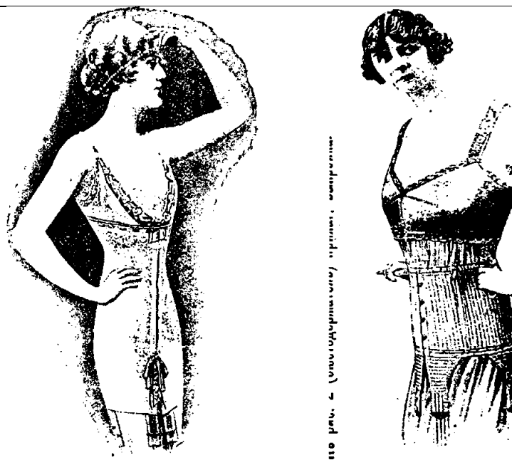
Иллюстрация 2. Корсеты 1910-х годов. 109