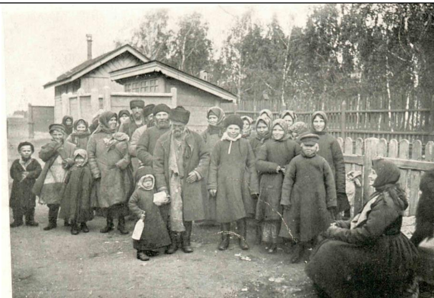
Иллюстрация 1. Переселенцы на вокзале в Челябинске 108 .