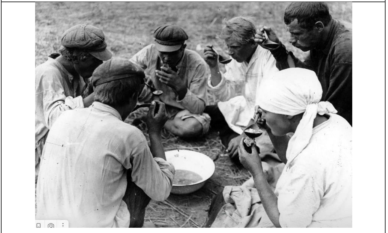
Иллюстрация 4. Обед в поле. Кубань. 1928 111 .