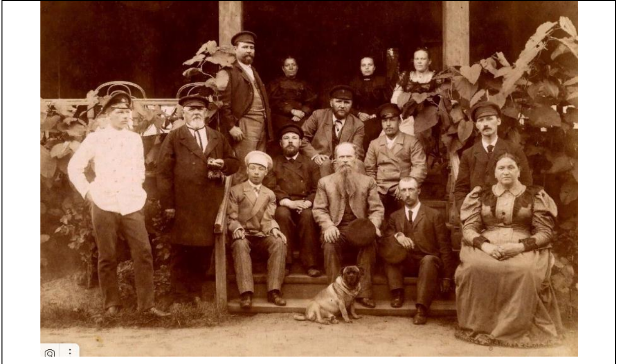
Иллюстрация 3. Рыбинск. Тропские, купеческая семья 110 .