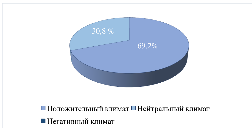
Рисунок 2 – Показатели психологического климата в рамках когнитивного компонента

Анализируя когнитивный компонент, мы выявили, что 69,2 % младших школьников имеют также положительный климат в классе (рисунок 2). Это значит, что между участниками образовательной среды налажен процесс обмена знаниями, сотрудничество внутри коллектива, а также данный уровень психологического климата проявляется в осознании ребенком принадлежности к группе и достигается путем сравнения своего класса с другими по ряду значимых признаков.