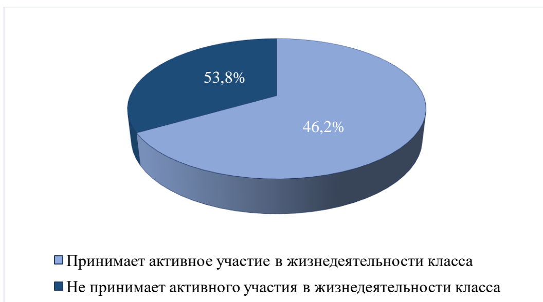
Рисунок 4 – Показатели работы учителя по созданию благоприятного психологического климата в коллективе младших школьников

школьников и активно проводит систематическую работу с классом, активно принимает участие в сплочении детей во время внеурочной деятельности, организуя различные поездки и экскурсии (рисунок 4).