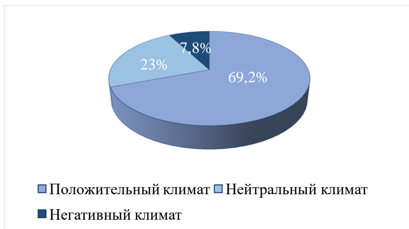
Рисунок 1 – Показатели психологического климата в рамках эмоционального компонента

Анализируя когнитивный компонент, мы выявили, что 69,2 % младших школьников имеют также положительный климат в классе (рисунок 2). Это значит, что между участниками образовательной среды налажен процесс обмена знаниями, сотрудничество внутри коллектива, а также данный уровень психологического климата проявляется в осознании ребенком принадлежности к группе и достигается путем сравнения своего класса с другими по ряду значимых признаков.