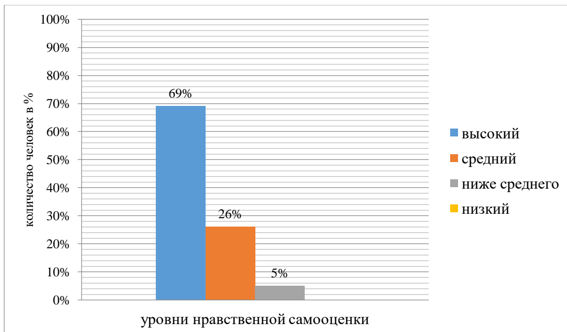
Рисунок 1 – Результаты исследования по методике 1. Диагностика уровня нравственной самооценки (методика Н.Е. Богуславской)

С обучающимися было проведено исследование уровня школьной мотивации по методике «Диагностика уровня нравственной самооценки» (методика Н.Е. Богуславской)». Результаты исследования по данной методике представлены на рисунке 1 и в ПРИЛОЖЕНИИ 2, таблице 2.1.