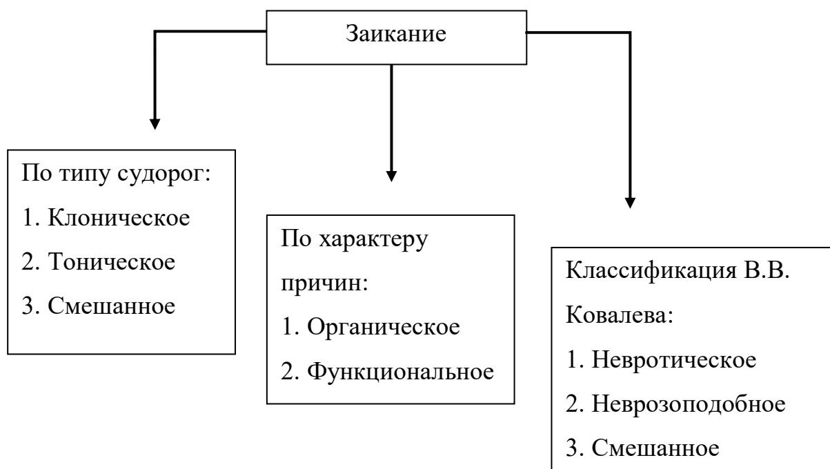
Схема 1- Классификация заикания

Невротическое заикание возникает в условиях острой или хронической психической травмы, например, испуга, в возрасте 2-6 лет и в дальнейшем носит волнообразный характер. Еще одной причиной возникновения данной формы заикания у школьников является активное введение в общение второго языка в 1,5-2,5 года жизни, что бывает у детей, которые еще в силу возрастных особенностей не овладели в достаточной степени родным языком и овладение вторым языком связано с большим психическим напряжением, которое для ряда детей является патогенным фактором [6].