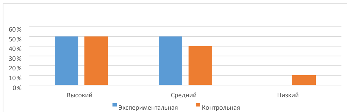
Рисунок 1 – Оценка уровня самостоятельности детей по мониторингу «Карта проявления самостоятельности» (А. М. Щетинина) Мы взяли 10 детей как 100%, соответственно 1 ребенок – 10%.

Для более наглядного представления полученных данных был составлен график процентного соотношения показателей (Рисунок 1)