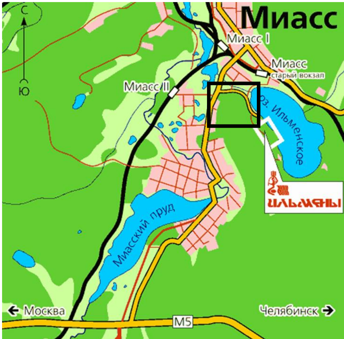
Рисунок 1 – Расположение лесополосы у подножия Ильменского хребта