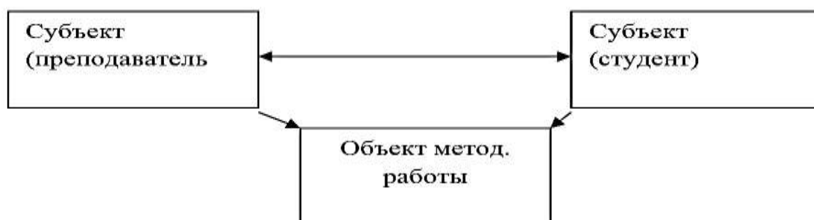
Рис. 2. Схема методического сопровождения

Схематично данный процесс можно выразить следующей схемой: