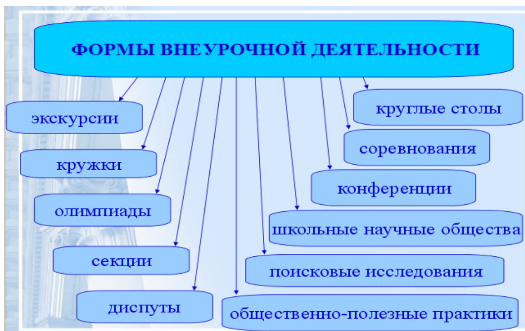
Рис. 4. Формы внеурочной деятельности

Для достижения воспитательных результатов во внеурочной деятельности используются различные формы ее организации (Рис.4)