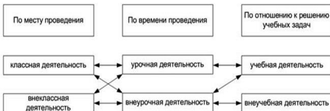
Рис. 1. Взаимосвязь различных видов деятельности школьников (по А.Л. Трофимовой )

В классе могут проводиться как урочные, так и внеурочные занятия. Многие урочные занятия проводятся вне класса (урок природоведения в парке, физкультура на спортивном стадионе). Экскурсии, турпоходы проводятся вне класса и во внеурочное время. Из вышесказанного следует, что допустимо отождествлять понятия классной и урочной деятельности, а также внеклассной и внеурочной деятельности.