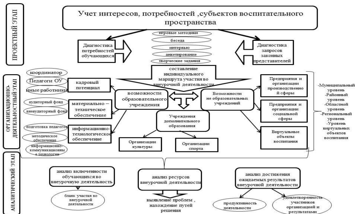
Рис. 9. Проект воспитательного пространства во внеурочной деятельности

Для осуществления более глубокого и детального анализа включенности учащихся во внеурочную деятельность необходимо обладать достаточной и систематизированной информацией об участии школьников в деятельности во внеурочное время. Для этого необходимо определить порядок сбора, обработки и хранения нужных сведений.