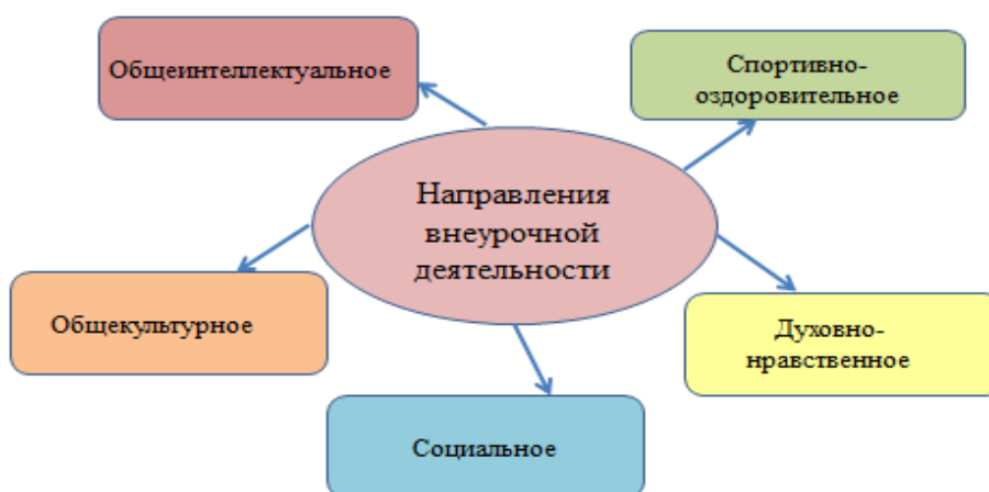
Рис. 3. Направления внеурочной деятельности

Под понятие внеурочной деятельности попадают все те виды школьной деятельности, кроме учебной деятельности на уроке в которых возможно и целесообразно решение задач их воспитания и социализации. В новом образовательном стандарте внеурочная деятельность организуется по направлениям развития личности (Рис. 3).