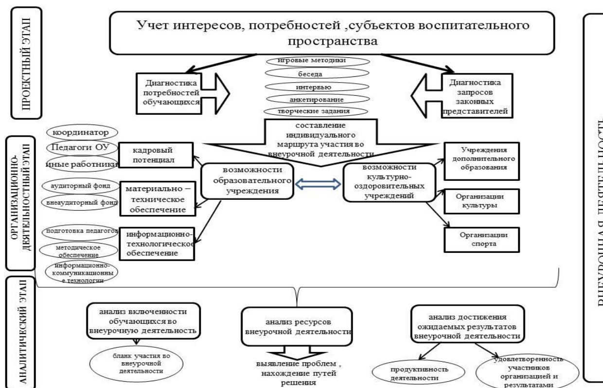
Рис. 8. Проект воспитательной системы во внеурочной деятельности

Рассмотрим проект воспитательного пространства образовательного учреждения во внеурочной деятельности (Рисунок 8).