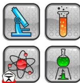
Рис.3 Эмблема НОУ «Эрудит»

Девиз: «Non progredi est regredi» (Не идти вперед – значит идти назад);