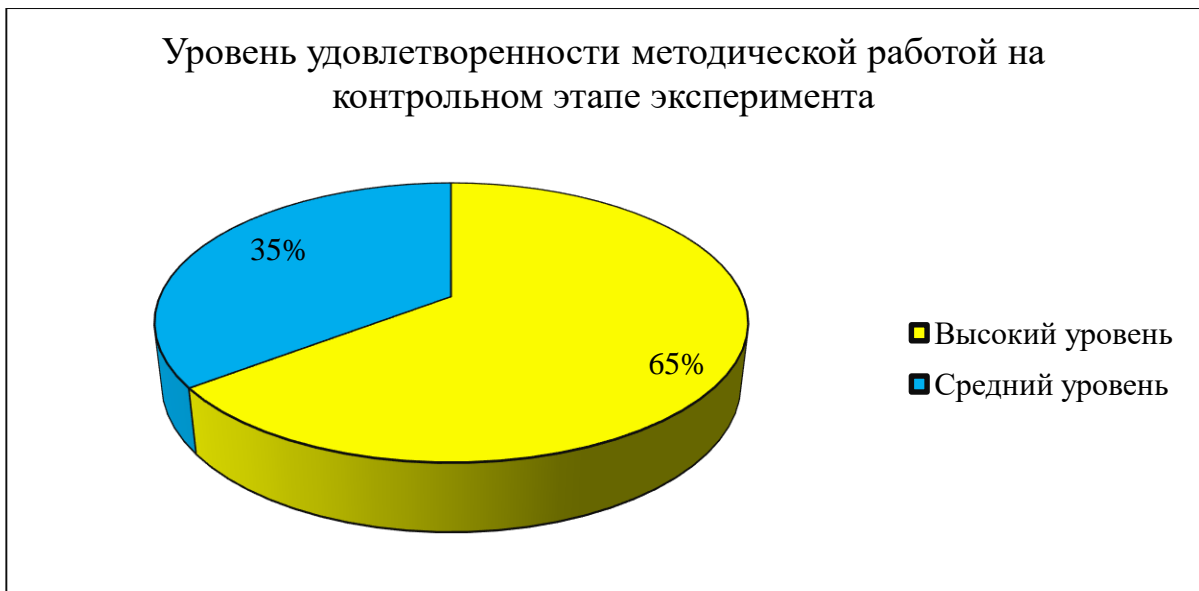
Рисунок 6 – Уровень удовлетворенности методической работой на контрольном этапе эксперимента

Отмечаем, что в результате проведения педагогических советов в нетрадиционной форме, повысилась вовлеченность педагогов в управление школой, педагоги проявили интерес к инновационной работе. Проведение мастер-классов позволило обмениваться профессиональным опытом, коллективно решать возникающие проблемы.