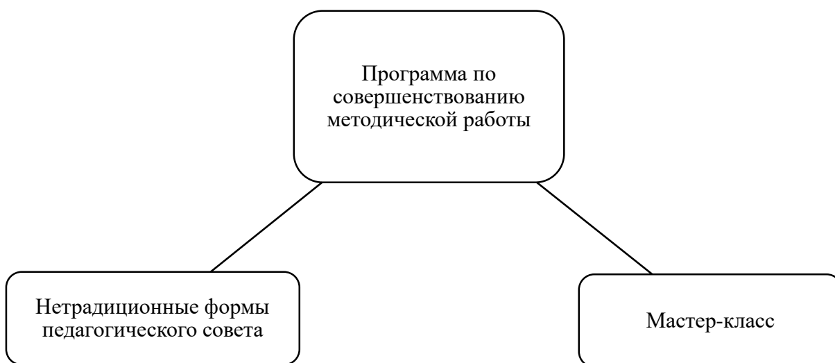
Рисунок 5 – Структура программы по совершенствованию методической работы в образовательной организации

работы образовательной организации включала комплекс инновационных коллективных форм работы методической службы – рисунок 5.