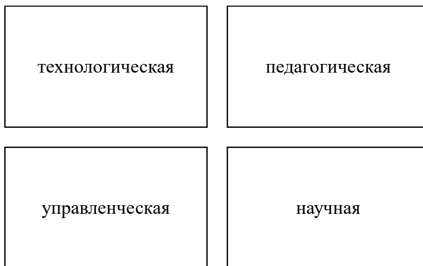
Рисунок 1 – Направления деятельности методической работы

В некоторых исследованиях выделяют следующие направления деятельности, которые представлены на рисунке 1.