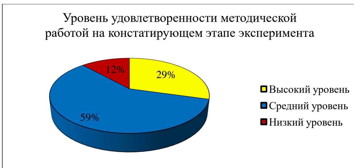
Рисунок 4 – Уровень удовлетворенности методической работой на констатирующем этапе эксперимента

На рисунке 4 представлены результаты проведенного анкетирования.