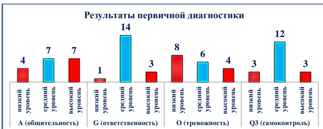
Рисунок 2 - тест «Исследование личностных качеств обучающихся»