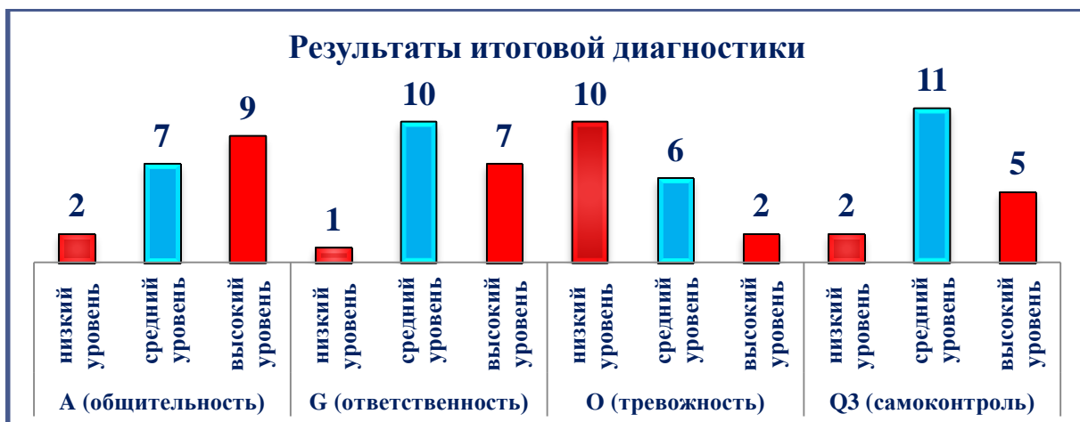
Рисунок 3 - тест «Исследование личностных качеств обучающихся»