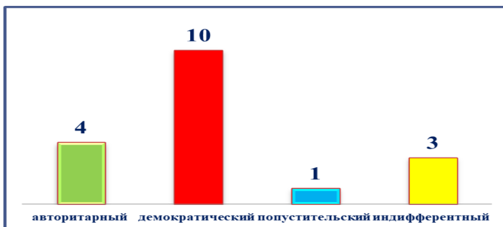
Рисунок 1 - Результаты исследования по диагностической методике «Стратегии семейного воспитания» С.С.Степанова (определение стиля родительско-детских взаимоотношений)