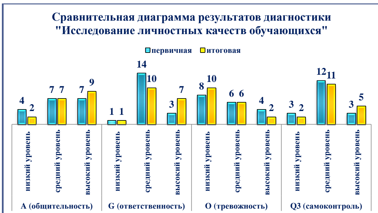
Рисунок 4 – сравнительная диаграмма результатов диагностики «Исследование личностных качеств обучающихся»