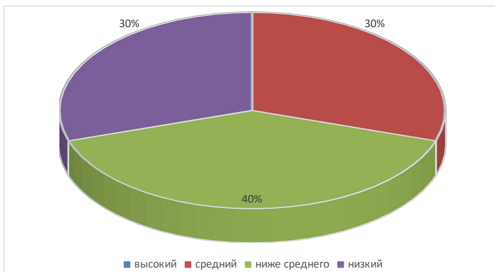
Рисунок 8 - Уровни развития интонационной выразительности речи

Для лучшей наглядности проведенной диагностики интонационной стороны речи по методике О.И. Лазаренко уровни развития интонационной выразительности речи представлены в виде диаграммы (рисунок 8).