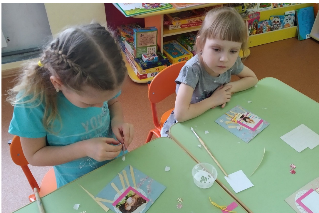
Рисунок 10 – Процесс работы над скрап-страничкой (2)