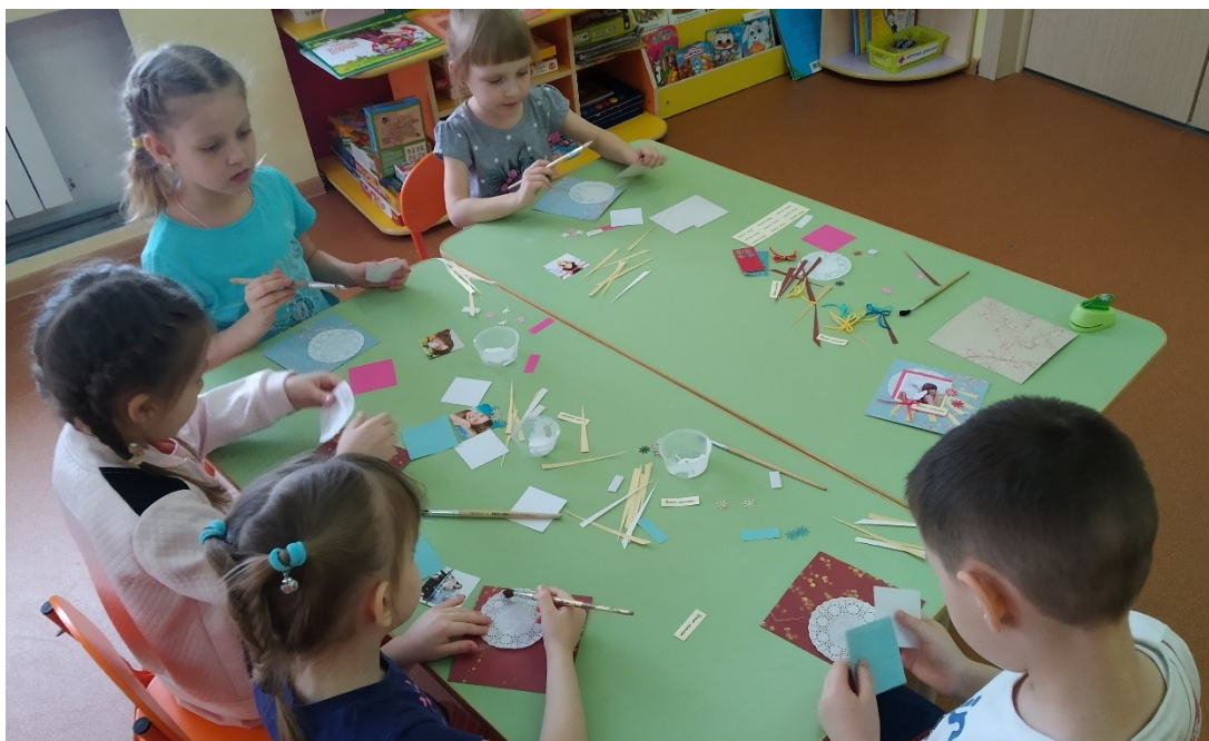
Рисунок 9 – Процесс работы над скрап-страничкой (1)