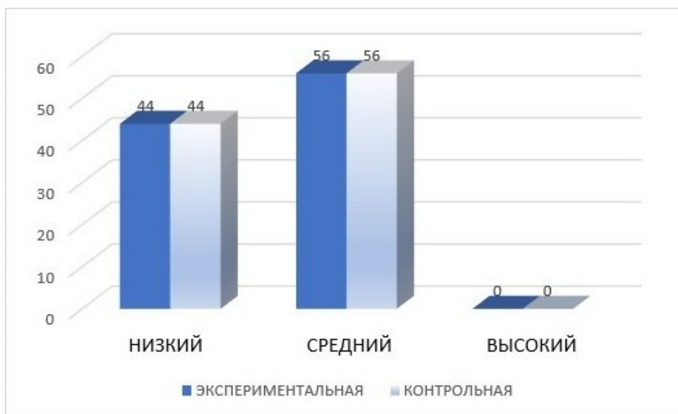
Рисунок 3 – Результат по критерию «гибкость мышления» на констатирующем этапе

У экспериментальной группы по показателю «гибкость мышления» результаты аналогичны контрольной. Средний уровень имеет 56% (14 детей), 44% (11 детей) – дети с низким уровнем.