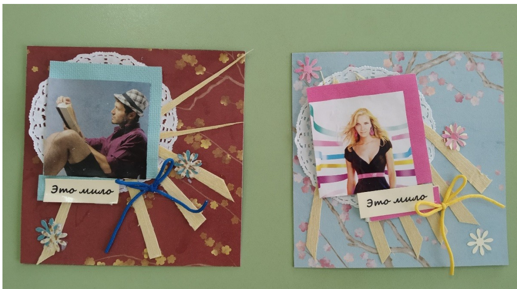
Рисунок 11 – Получившиеся работы (1)