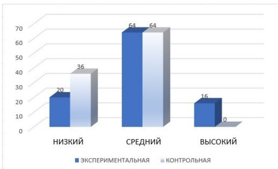
Рисунок 5 – Результат по критерию «оригинальность мышления» на контрольном этапе

Критерий «Разработанность идеи». Задание №2 «Незавершенные фигуры».