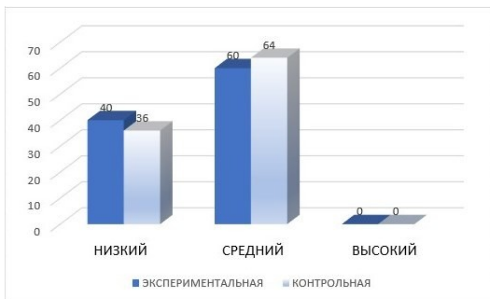
Рисунок 4. – Результат по критерию «беглость мышления» на констатирующем этапе

У экспериментальной группы средний уровень имеют 60% (15 детей), у 40% (10 детей) – низкий уровень. Высокого уровня не наблюдается, как и в контрольной группе.