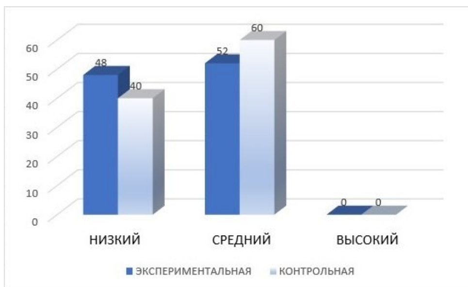
Рисунок 2 – Результат по критерию «разработанность идеи» на констатирующем этапе

развития, предпринимают попытки детальной проработки изображения. Высокого уровня не наблюдается.