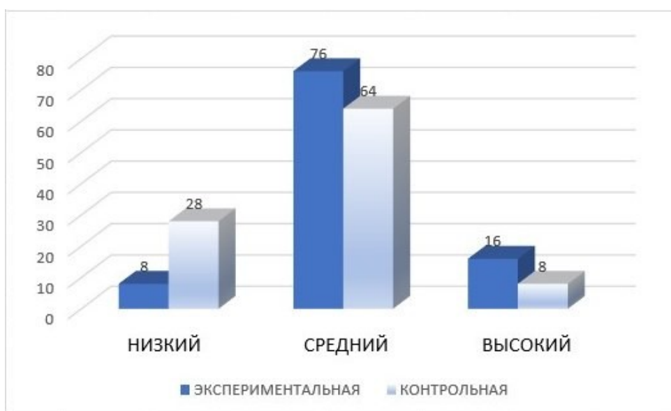
Рисунок 8 – Результат по критерию «беглость мышления» на контрольном этапе

Опираясь на данные, которые получены в результате анализа уровня развитости творческих способностей у детей старшего дошкольного возраста, можно сделать следующий вывод, что согласно выявленным критериям у диагностируемой группы воспитанников экспериментальной группы отмечается уровень сформированности творческих способностей – выше.