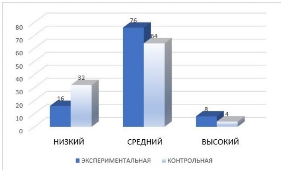
Рисунок 6 – Результат по критерию «разработанность идеи» на контрольном этапе

Критерий «Гибкость мышления». Задание №3 «Повторяющиеся фигуры».