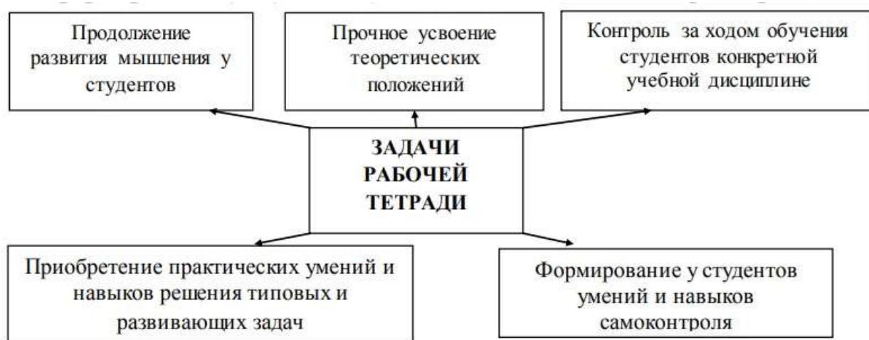
Рисунок 1 – Задачи рабочей тетради по правовым дисциплинам в профессиональной образовательной организации

Задачи рабочей тетради по правовым дисциплинам в профессиональной образовательной организации представлены на рисунке 1.