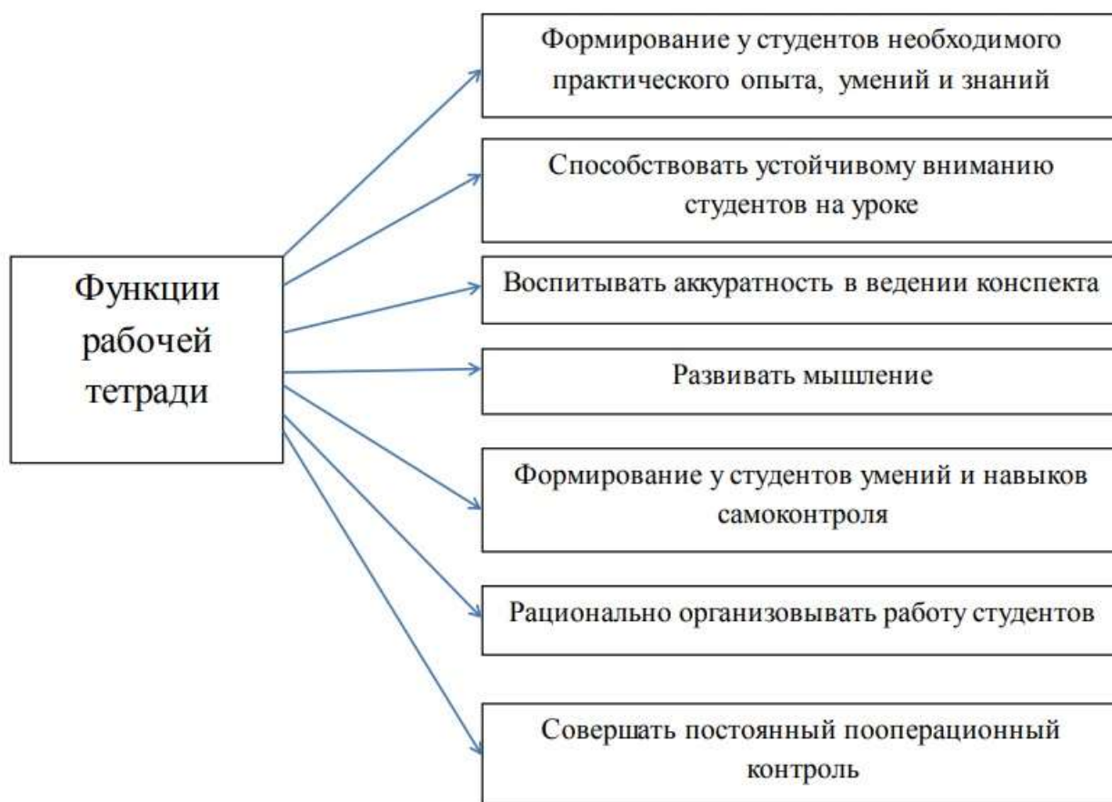
Рисунок 2 – Функции рабочей тетради [20, с. 123]

Функции рабочей тетради можно сгруппировать следующим образом (рис. 2).