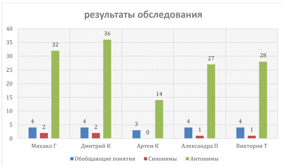
Рисунок 1 – Результаты обследования

При перечислении предметов мебели, обуви которую вы знаете, дети перечисляли не только мебель и обувь, но и предметы, ассоциирующиеся с данными предметами, либо действия связанные с этими предметами