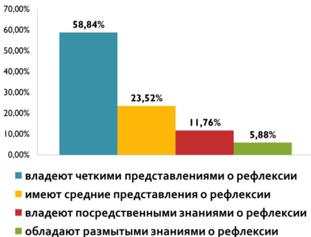
Рисунок 2 – Развитость рефлексивных умений студентов

Исходя из результатов письменных ответов на поставленные вопросы, 58,84% (10 человек) владеют четкими представлениями о рефлексии в учебном процессе, знают её цели и приемы; 23,52% (4 человека) имеют средние представления о рефлексии в учебном процессе и знают приемы используемые на занятиях; 11,76% (2 человека) владеют посредственными знаниями о рефлексии и её целях; 5,88% (1 человек) обладают размытыми знаниями о рефлексии.