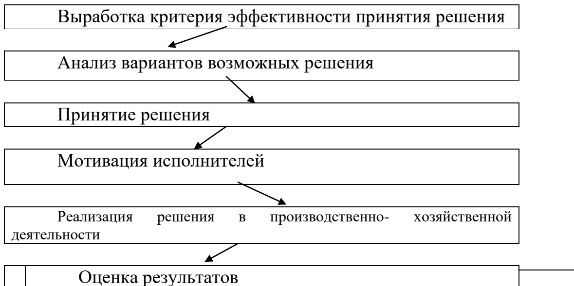
Рис. 2. Алгоритм принятия и реализации управленческих решений

Выработка и принятие решений – это творческий процесс в деятельности руководителей любого уровня, включающий элементы алгоритма, представленного на рис. 2.