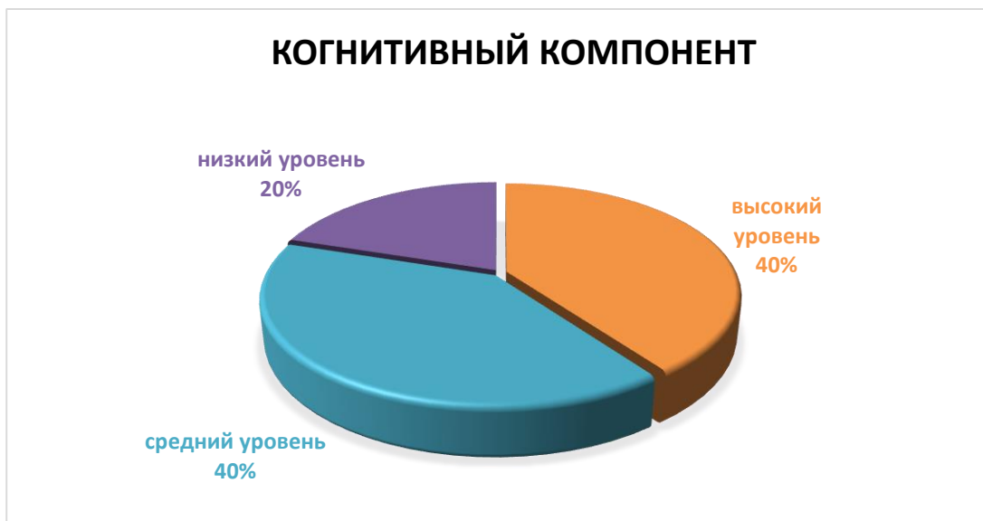
Диаграмма 5 – Уровень эстетического воспитания учащихся по когнитивному компоненту, в %

В ходе оценки сформированности когнитивного компонента у учащихся в результате обучающего эксперимента были выявлены следующие результаты: у 6 (40%) учащихся был выявлен высокий уровень эстетического воспитания. У 6 (40%) детей был выявлен средний уровень. У 3 (20%) учащихся был выявлен низкий уровень.