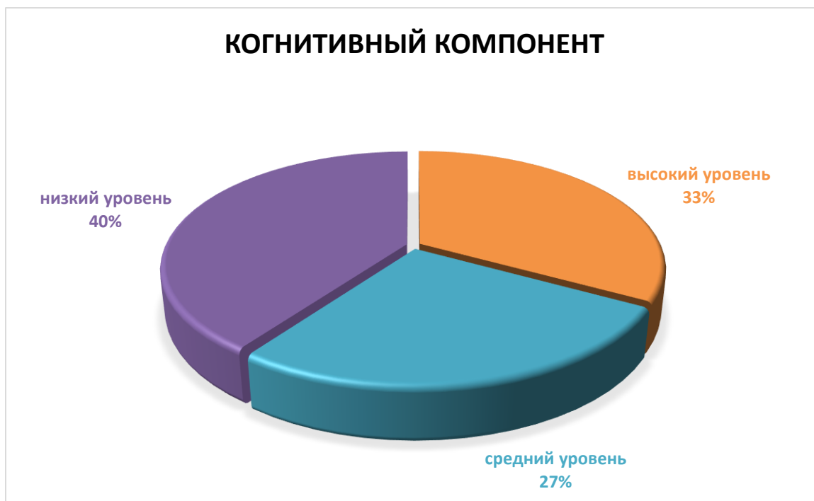
Диаграмма 2– Уровень эстетического воспитания учащихся по когнитивному компоненту, в %

мотивацию на приобретение знаний в области искусства, ориентируются в разных видах, произведениях и деятелях искусства.