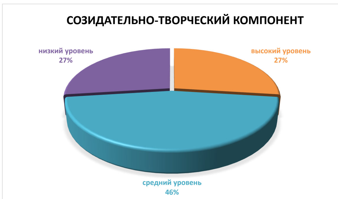
Диаграмма 3– Уровень эстетического воспитания учащихся по созидательно-творческому компоненту, в %

собирают художественные альбомы, посещают театры и проявляют желание связать свою будущую профессию с искусством.