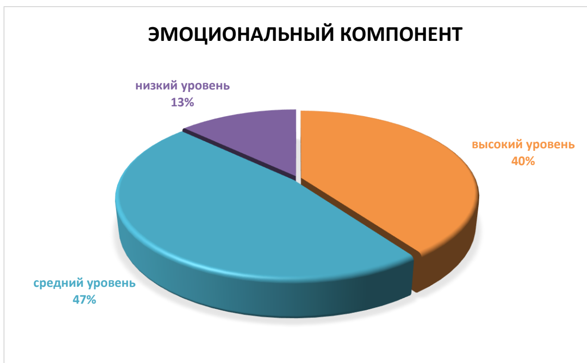
Диаграмма 1 – Уровень эстетического воспитания учащихся по эмоциональному компоненту, в %

Отмечено, что у 6 (40%) из них наблюдается высокий уровень эмоциональной составляющей, что свидетельствует о глубоком и точном восприятии произведений искусства, способности устанавливать связи между ними и формулировать свои мысли логично и развернуто. Низкий уровень эмоциональной составляющей был выявлен у 2 (13%) учащихся, что говорит о недостаточной готовности к восприятию эстетических искусств. Большинство – 7 (47%) учащихся – проявили средний уровень эмоциональной составляющей, что подразумевает способность установить взаимосвязь между произведениями искусства, понять замысел художника и композитора, однако их суждения могут быть неуверенными и неполными.