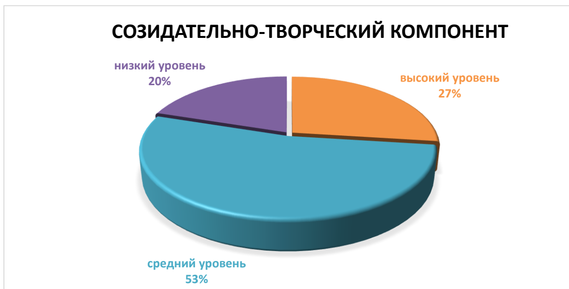
Диаграмма 6– Уровень эстетического воспитания учащихся по созидательно-творческому компоненту, в %

Выявлено, что высокий уровень эстетического воспитания по созидательно-творческому компоненту был у 4 детей (27%). Средний уровень эстетического воспитания по созидательно-творческому компоненту был выявлен у 8 детей (53%). Низкий уровень эстетического воспитания по созидательно-творческому компоненту был выявлен у 3 детей (20%).