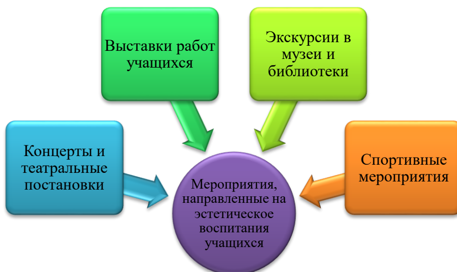
Рисунок 2 – Мероприятия, направленные на эстетическое воспитание учащихся

Один из наиболее ярких элементов культурной жизни школы – это концерты и театральные постановки, которые организуются в праздники для родителей и близких. Эти мероприятия не только способствуют проявлению творческого потенциала участников, но и помогают родителям увидеть результаты работы и развития своих детей в области искусства. Кроме того, они являются важной частью культурного образования детей и подростков, позволяя им расширять свой кругозор и узнавать о различных стилях и направлениях искусства.