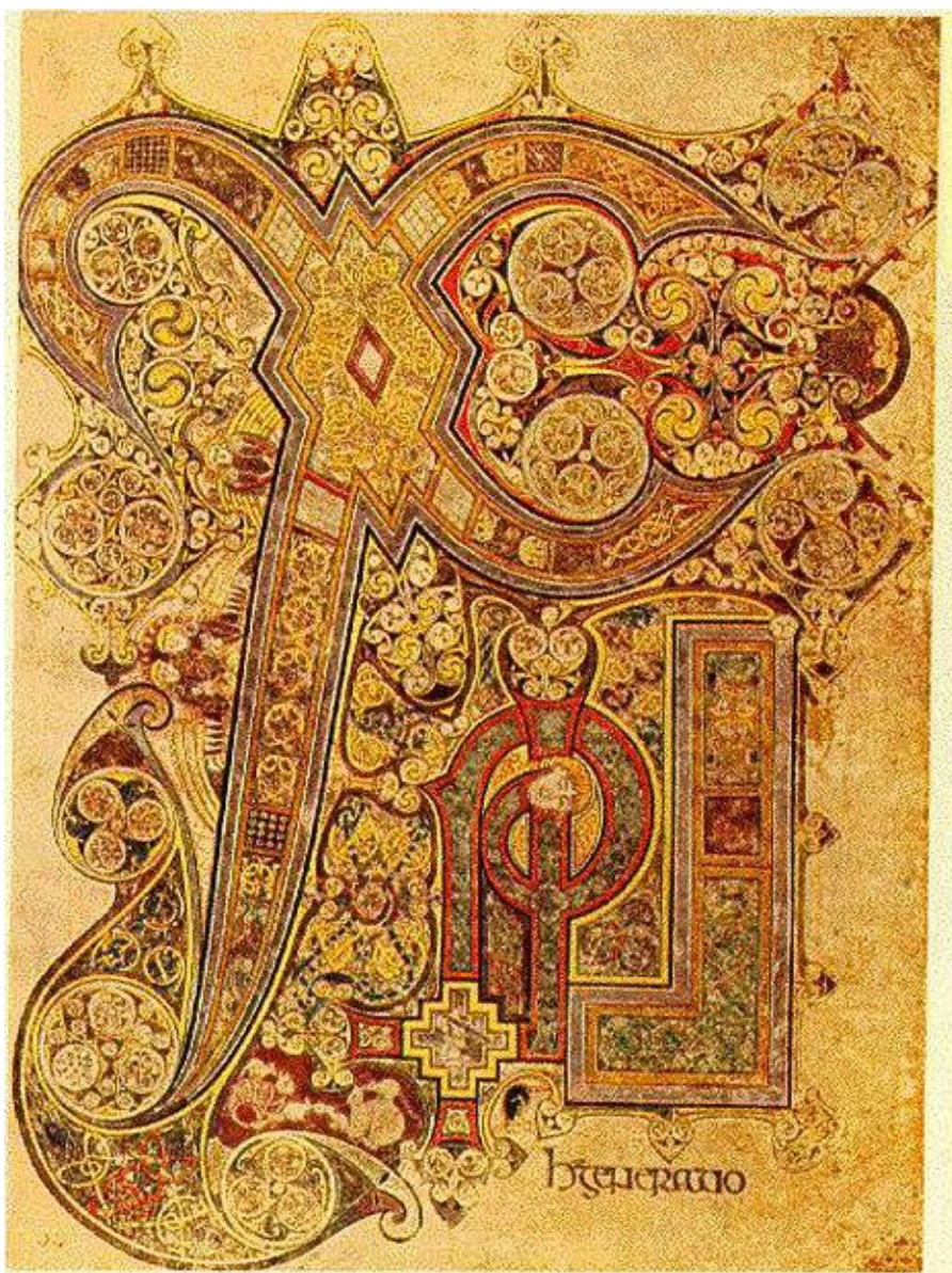
Евангелие из Келлса Инициал Рубеж VIII и IX веков Библиотека Тринити-колледжа, Дублин