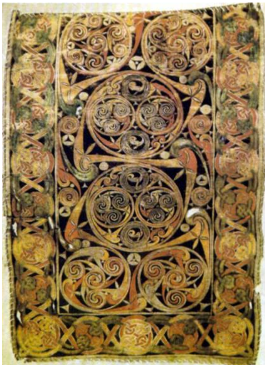
Евангелие из Дарроу «Страница-ковёр» ок. 680 Библиотека Тринити-колледжа, Дублин