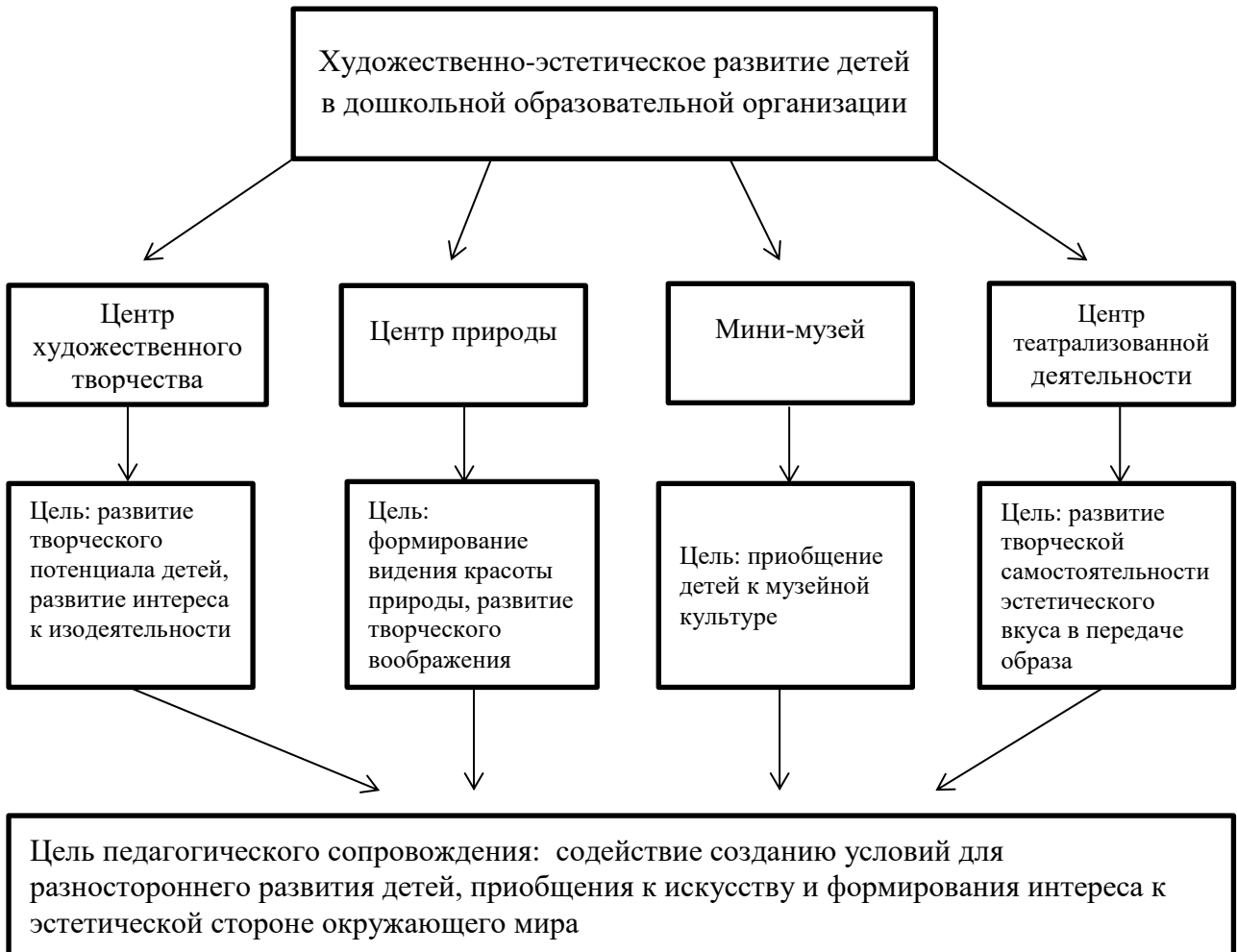
Рис. 1 Художественно-эстетическое развитие детей в дошкольной образовательной организации.

деятельности; 3) отбор методов и средств, позволяющих моделировать специальные педагогические ситуации, способствующие саморазвитию и художественному развитию личности [41]. Результатом объединения реализации этих параметров является создание художественно-эстетической среды в группе, соответствующей требованиям дошкольного образования (Рис. 1).