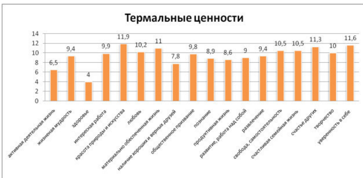
Рисунок 1 – Термальные ценности

Цель данного теста – выявление ценностных ориентаций учащихся. Молодым людям предлагаются два списка ценностей (терминальные – убеждения в том, что конечная цель индивидуального существования стоит того, чтобы к ней стремиться; и инструментальные – убеждения в том, что какой-то образ действий или свойство личности является предпочтительным в любой ситуации), которым необходимо присвоить каждой ценности свой номер в порядке значимости для самого человека. Полученные данные представлены в таблице 3 (см. Приложение 5). Средние значение места ценности для человека представлены в диаграмме 1,2 (Рисунок 1,2).