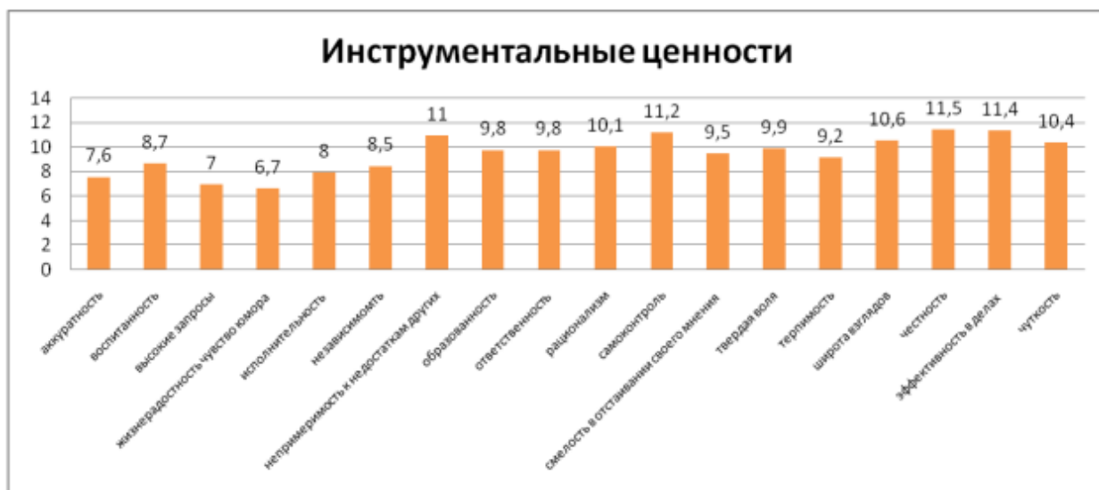
Рисунок 2 – Инструментальные ценности

Таким образом, терминальные ценности показывают, что большинство респондентов стремится к сохранению и улучшению здоровья. Активная жизнь и наличие хороших друзей также является главным в жизни молодых людей. Также в первом десятке ценностей находятся продуктивная жизнь, работа над собой, познание и развлечение. Вместе с тем наименьшее значение в их жизни имеют: жизненная мудрость, общественное призвание, интересная работа, творчество, любовь, семейная жизнь, свобода и самостоятельность, материальное обеспечение, счастье других, уверенность в себе. Все это говорит о том, что молодые люди нацелены на индивидуальные ценности: удовлетворение своих потребностей, получение блага для себя, забывая об окружающих, общечеловеческих ценностях (добро, милосердие, помощь нуждающимся и т.д.).