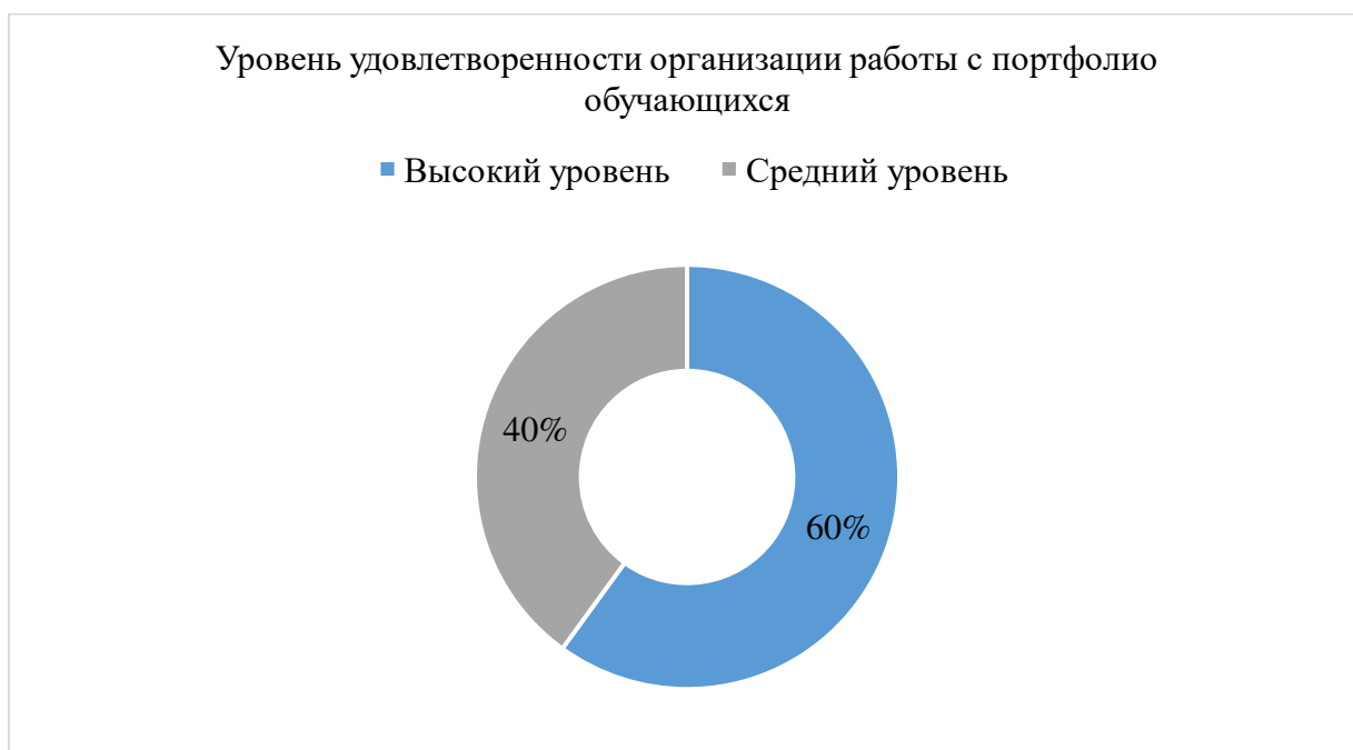
Рисунок 2 – Уровень удовлетворенности организации работы с портфолио обучающихся

Педагогов попросили выделить факторы, снижающие активность ведения портфолио, к ним отнесли: неподготовленность родителей к осознанию важности и значимости портфолио как документа, позволяющего подтвердить уровень имеющихся знаний у обучающихся; недостаточное умение учеников самостоятельно систематизировать и анализировать собственный собранный материал и опыт.