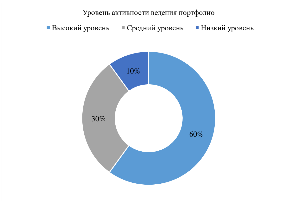
Рисунок 1 – Активность ведения портфолио

Были получены результаты, представленные на рисунках.