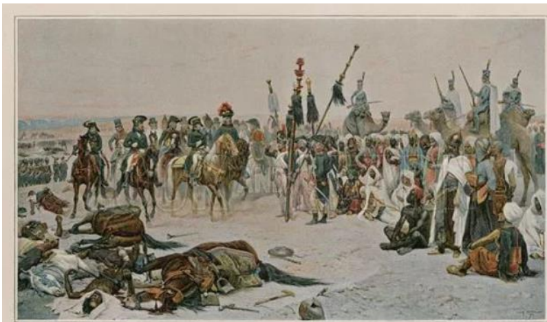
Э. Деталь «Столкновение французских войск с силами мамлюков в пустыне»;