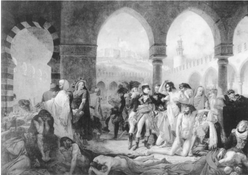
А.-Ж. Гро. «Бонапарт посещает больных чумой в Яффе»;