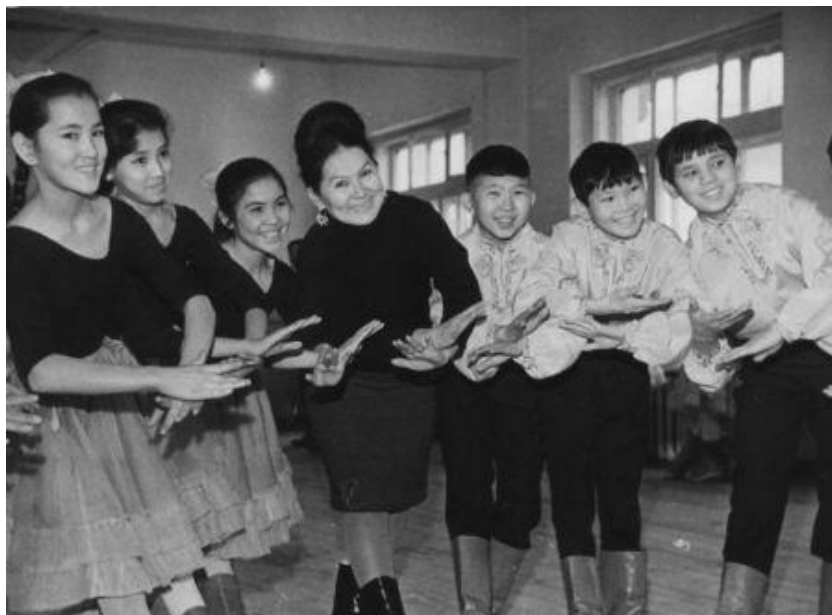
Урок казахского танца в хореографическом училище