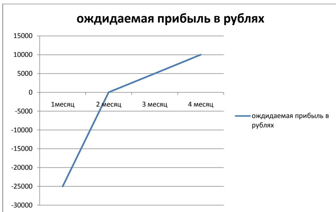
График № «ожидаемая прибыль футбольной секции в первый период деятельности»

Ниже представлен график прогнозируемого развития футбольной секции на базе общеобразовательной школы.