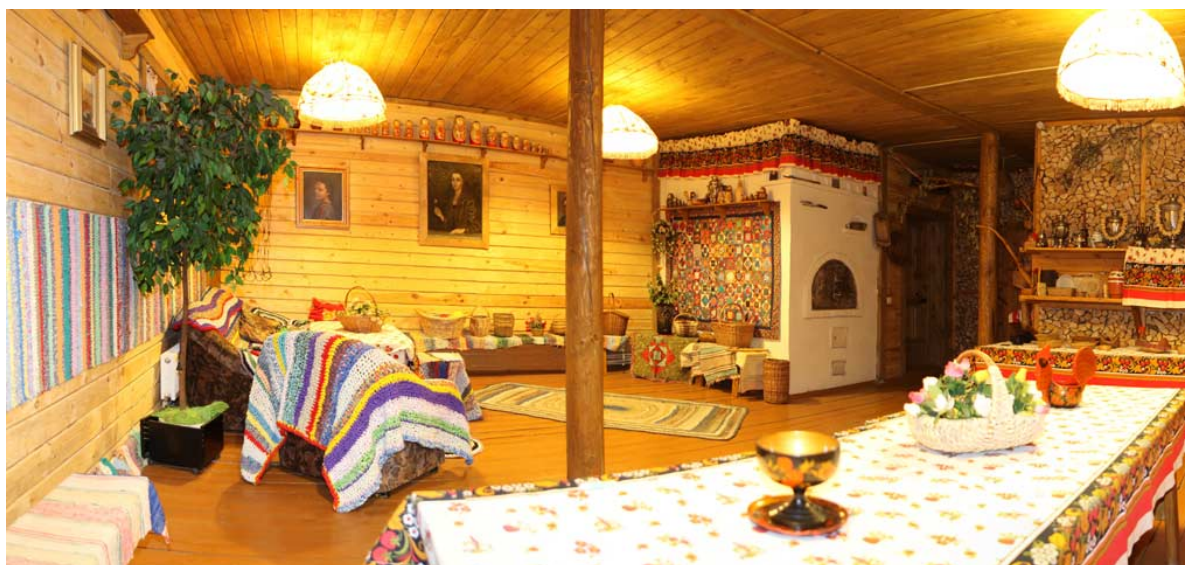
Изба и ее убранство

Стимульный материал для диагностики знаний детей по теме: Русское подворье: