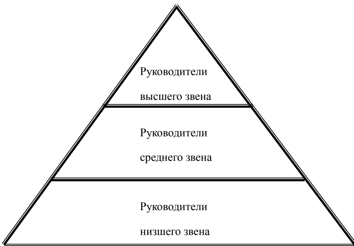
Рисунок 4. Уровни управления организации

Обычно выделяют три уровня управления предприятием, которые представляются в виде иерархической пирамиды управления.