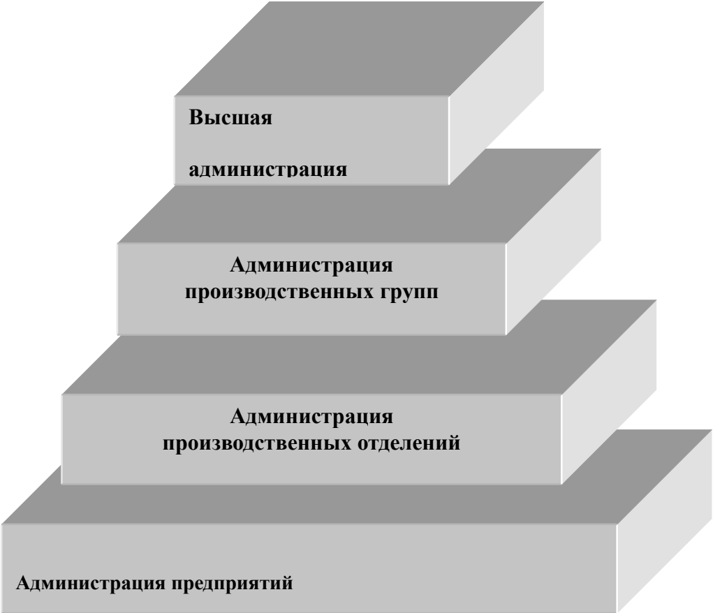
Рисунок. 7. Четырёхступенчатая пирамида управления