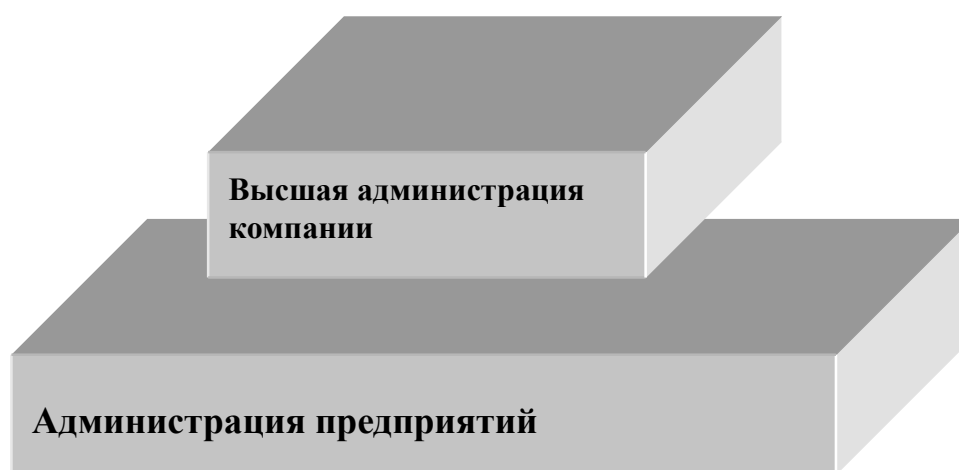
Рисунок 5. Двухступенчатая пирамида управления

бригадиры, начальники секций, старшие клерки, заведующие секторами. Их деятельность отличается разнообразием и оперативностью, им приходится решать множество текущих задач, они не выходят из производственного организационного ритма. Руководители среднего звена – это руководители крупных подразделений, отделов или служб предприятия. Руководителем среднего звена может быть заведующий производственным отделом, начальник отдела кадров, управляющий сбытом по региону. Набор функций руководителя данного уровня определяется содержанием работы возглавляемого им подразделения. На крупных предприятиях средний уровень управления может быть разделен на высший и низший. Руководители высшего звена отвечают за принятие решений, касающихся предприятия в целом или его основной части. К руководителям высшего звена относятся председатель совета директоров, директор и его заместитель, генеральный директор акционерного общества и его заместители (президент и вице-президенты предприятия), директора по направлениям. В тех случаях, когда компания представляет собой комплекс предприятий (заводов, фабрик и т. п.), иерархическая структура управления принимает более сложный вид. В самом простом виде это двухступенчатая пирамида (Рисунок 5).