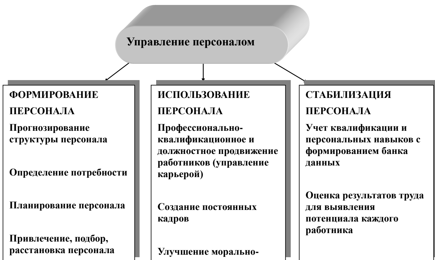
Рисунок 8. Стадии системы управления персоналом

Формирование (становление) персонала организации – особая стадия, в процессе которой закладываются основа его инновационного потенциала и перспективы дальнейшего наращивания. Эта стадия является исключительно важной в жизненном цикле нового предприятия. От своевременного и полного решения социально-экономических и организационных задач во многом зависит его эффективная работа. Отклонение численности персонала от научно обоснованной потребности предприятия в ней, как в меньшую, так и в большую сторону влияет на уровень трудового потенциала. Это значит, что как дефицит, так и излишек персонала одинаково отрицательно влияют на трудовой потенциал. Так, нехватка персонала приводит к недоиспользованию производственного потенциала и чрезмерной нагрузке на работников; содержание излишней численности ведет к недоиспользованию их индивидуального потенциала.