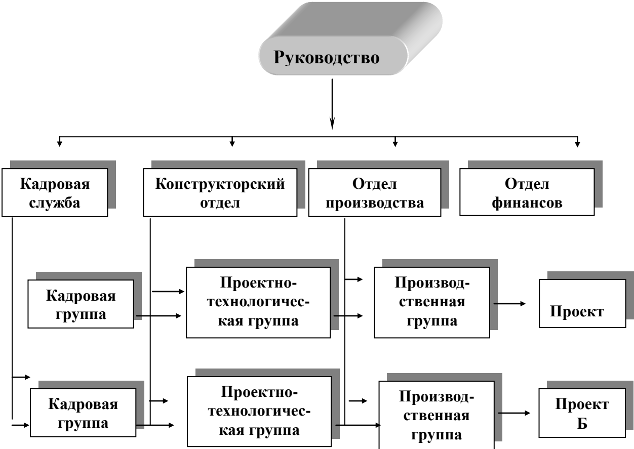
Рисунок 3. Матричная структура предприятия

Так родилась матричная структура (Рисунок 3.). В отличие от функциональной и дивизиональной организации матричная организация является структурой гибкой, способной к изменениям в зависимости от целей предприятия и условий производства. Наряду с постоянно существующими основными функциональными подразделениями на предприятиях формируются из числа соответствующих работников специальные временные функциональные группы для осуществления проектов, разрабатываемых предприятием.