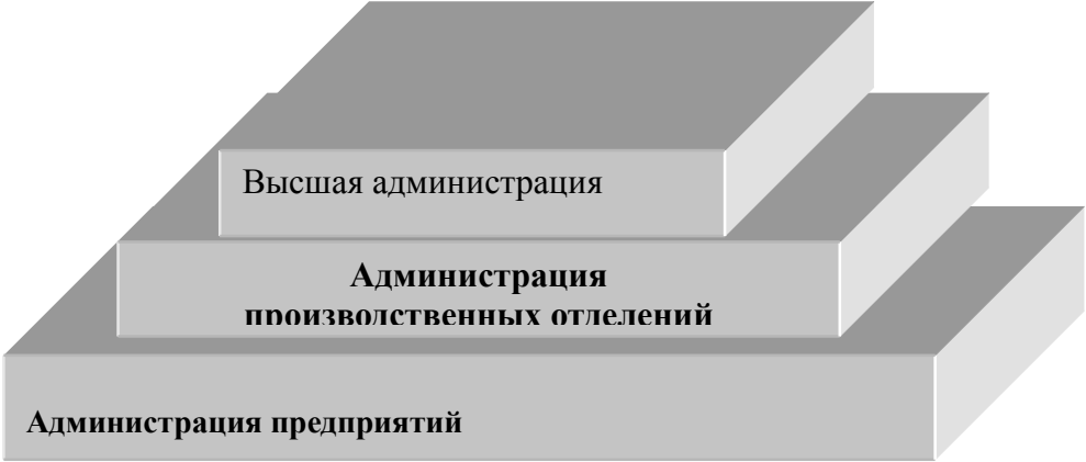
Рисунок 6. Трехступенчатая пирамида управления

четырёхступенчатой пирамиды, которая характерна, например, для крупных современных концернов (Рисунок 7).