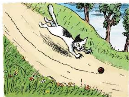
Катился и скрылся клубок.