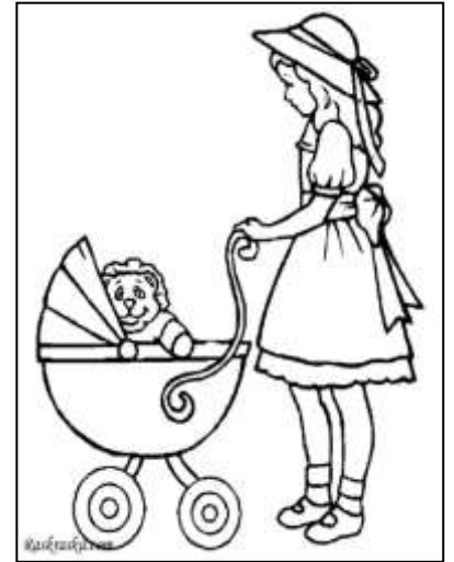
Рис. 3. Девочка катает коляску