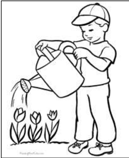
Рис. 1. Мальчик поливает цветы.