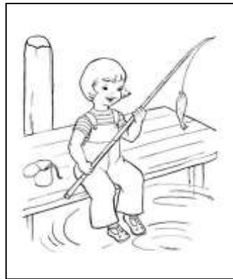
Рис. 4. Мальчик ловит рыбу