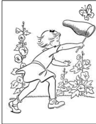
Рис. 2. Девочка ловит бабочку