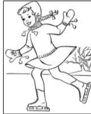
Рис. 5. Девочка катается на коньках