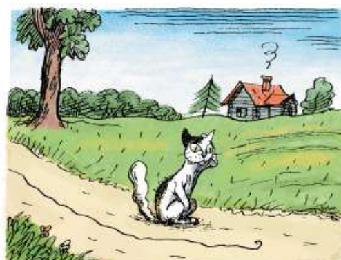
Но я догадался, куда он девался, А кот догадаться не мог.