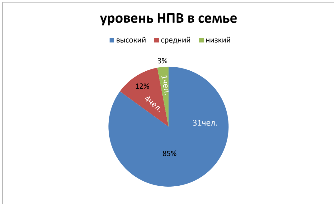
Рис.3 – нравственно-патриотическое воспитание в семье

И при анкетировании семьи, 36 человек по нравственно-патриотическому воспитанию были выявлены следующие закономерности (рис.3).