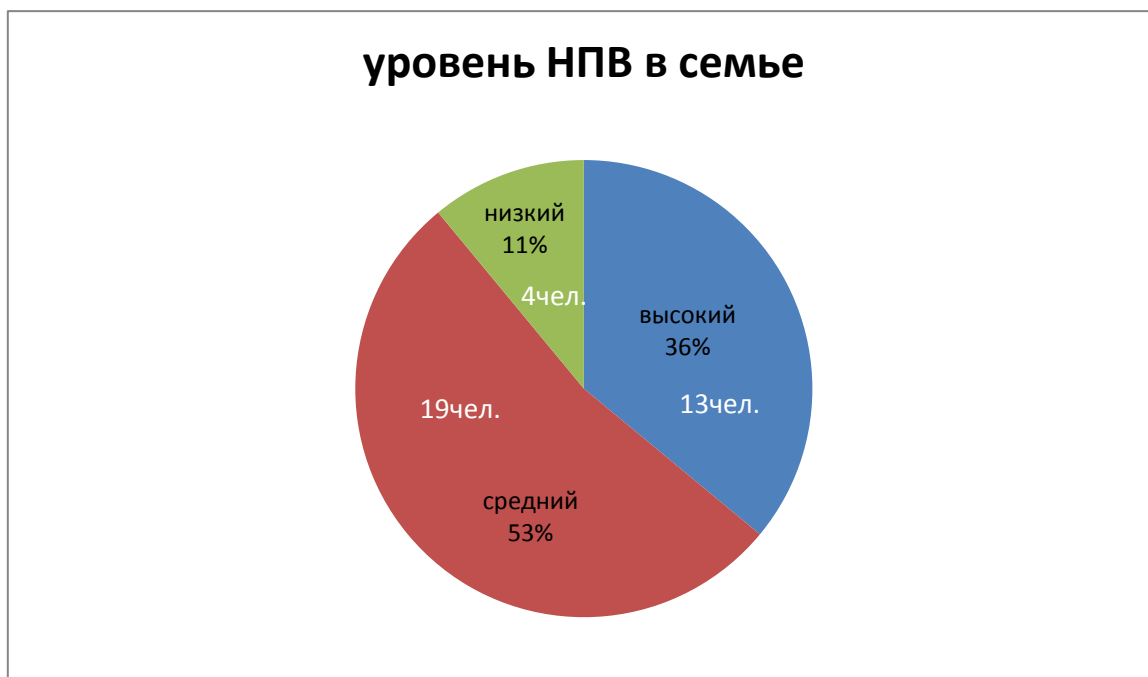
Рис.1- Нравственно-патриотическое воспитание в семье

И при анкетировании семьи, 36 человек по нравственно-патриотическому воспитанию были выявлены следующие закономерности (рис.1).