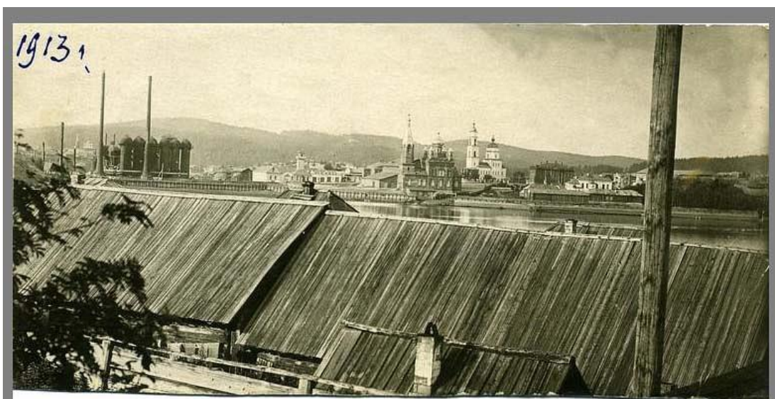
Саткинский завод. Вид от госпиталя. 1913 г.

Саткинский завод. Вид от госпиталя. Фотография 1913 г. 4