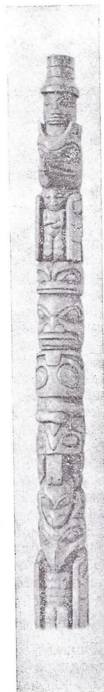
Тлинкитский тотемный столб.