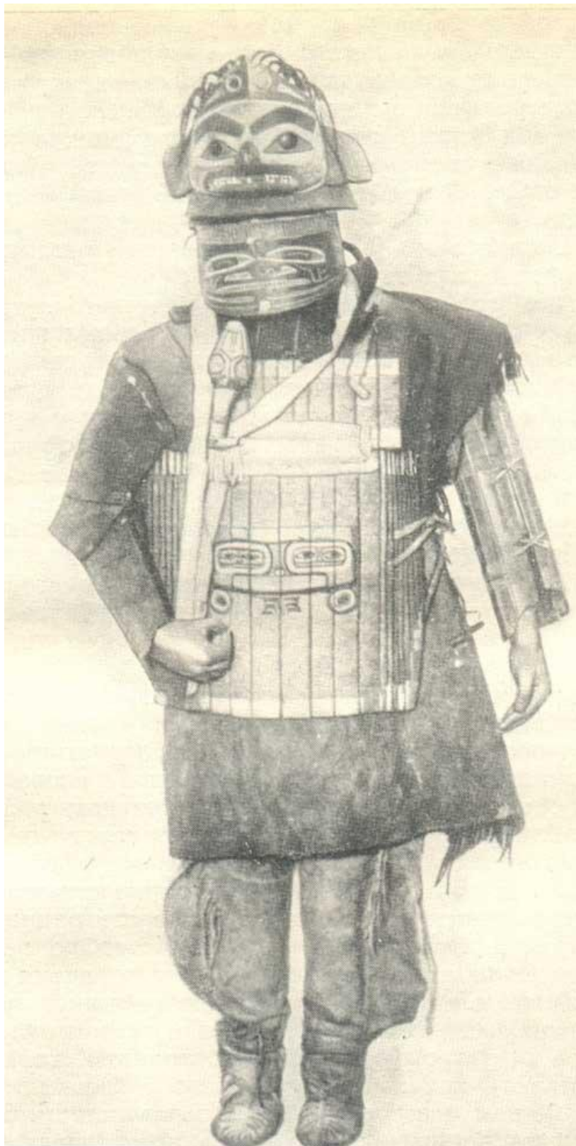
Тлинкитский воин в доспехах