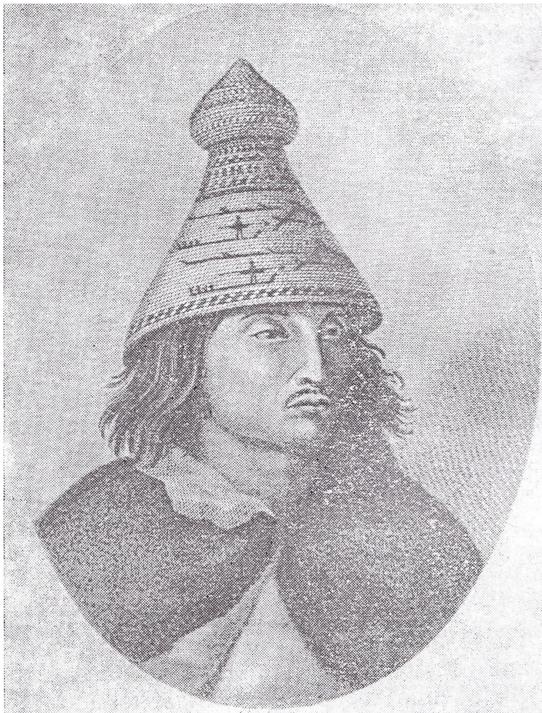
Представитель племени тлинкитов

Источник: Североамериканские индейцы / Редакция Ю.П. Аверкиевой. М., 1978.