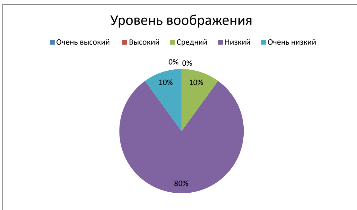
Рис.1. Уровень развития воображения у детей старшего дошкольного возраста с задержкой психического развития по методике «Нарисуй что-нибудь».