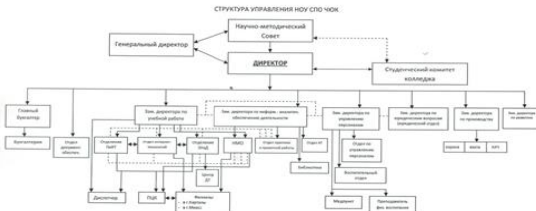
Рисунок 1. Организационная структура ПОУ «Челябинский юридический колледж»

Из рисунка 1 видно, что организационная структура носит линейный характер. Широкий спектр учебной, научной и воспитательной деятельности объясняет наличие семи заместителей директора колледжа.