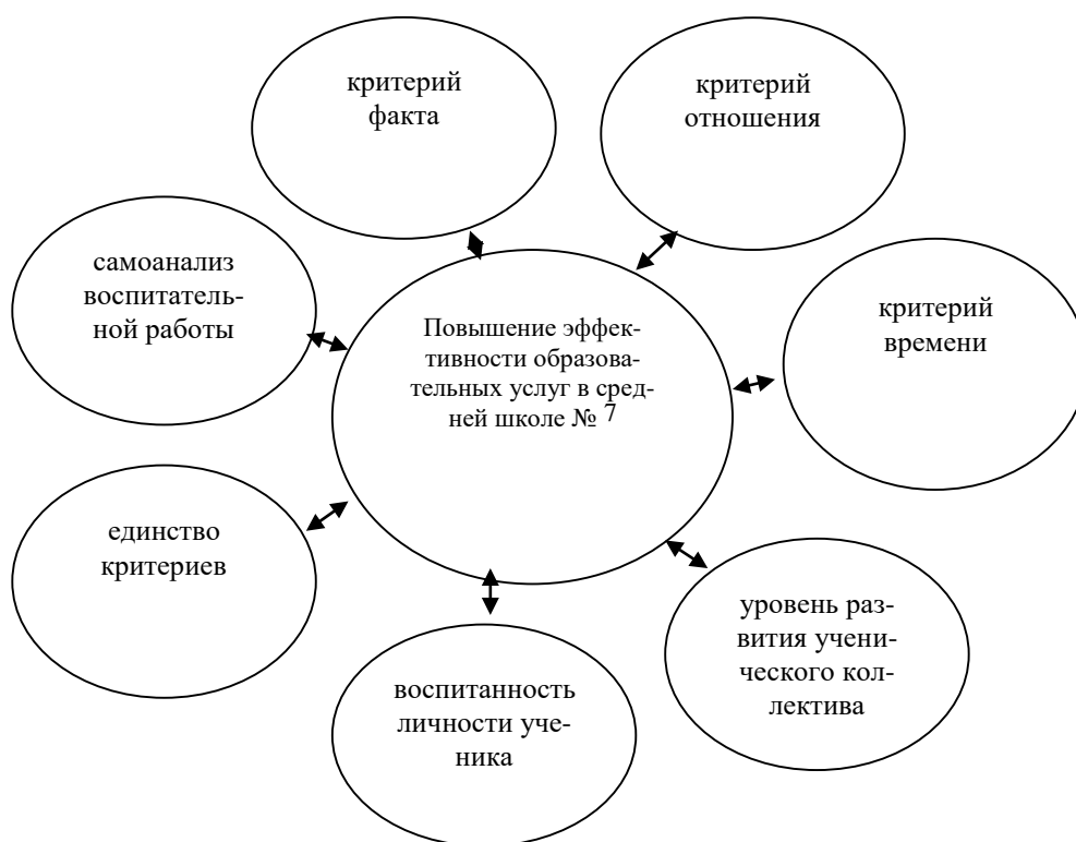
Рис. 2. Критерии эффективности образовательных услуг, которые необходимо учесть при реализации предлагаемых мероприятий.

В ходе всех проверок внимание должно сосредотачиваться не только на выявлении недостатков, но и на анализе положительного опыта.