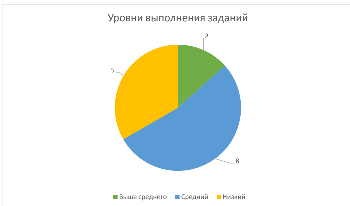
Рис. 1. Уровень развития вербальных и невербальных средств эмоциональной выразительности у детей младшего школьного возраста с ЗПР

Графическая интерпретация результатов по методике О.Е. Шаповаловой «Спой выразительно» представлена на рисунке 1.