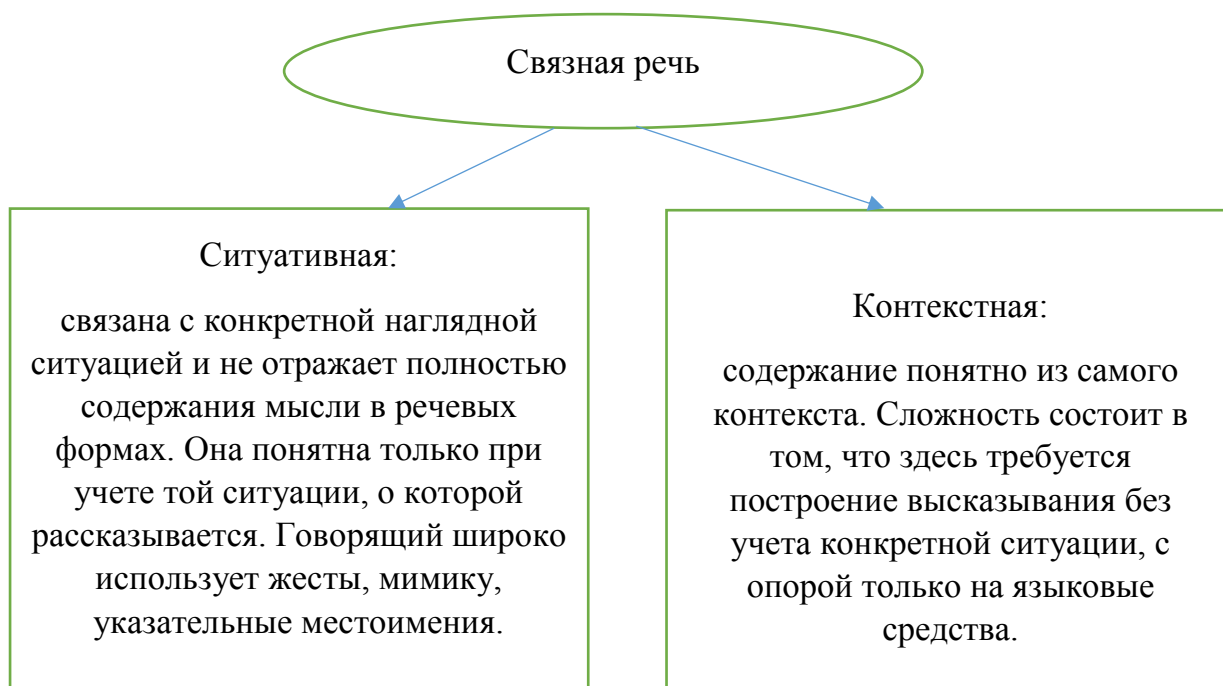
Схема 2. Сравнительная характеристика ситуативной и контекстной речи.

Связная речь также может быть ситуативной и контекстной. Отличительные характеристики представлены в Схеме 2 [1, 255].