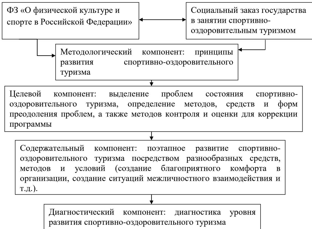
Рисунок 1 – Компоненты программ развитие спортивно-оздоровительного туризма

При этом, как полагает Г.Л. Монастырский, программные компоненты должны опираться на следующие концептуальные положения: