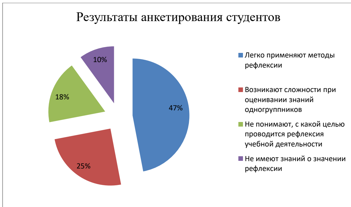
Рис. 2. Развитость рефлексивных умений студентов и правильного оценивания собственной учебной деятельности

На основании результатов анкетирования нам удалось выяснить, что большинство студентов группы № РК-143, 1 курса, очного отделения, по специальности "Реклама", готовы к обучению в техникуме, но не обладают умениями объективно оценивать свои достижения. Также, мы определили, какие методы, по мнению обучающихся, наиболее целесообразны на занятиях, и с какими сложностями они сталкиваются при проведении педагогами рефлексии.