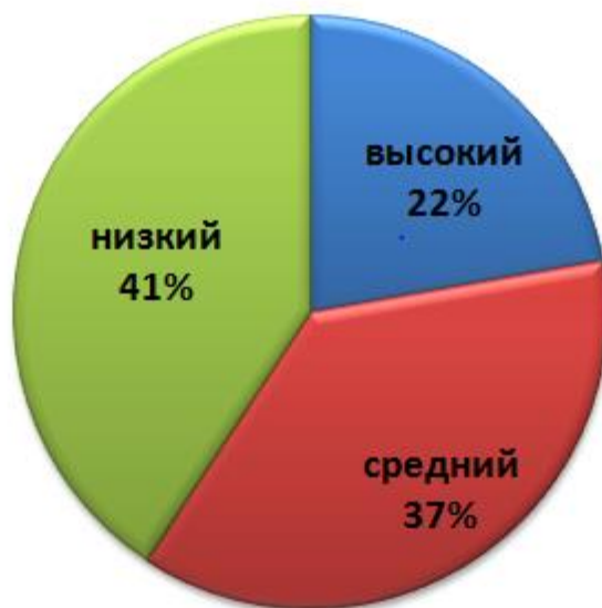
Рисунок 1 – Уровни сформированности познавательной деятельности в 4 «Б» классе

Таким образом, мы видим, что 6 учащихся, а это 22 % от класса, обладают высоким уровнем сформированности познавательной активности. Это младшие школьники, которые сочетают присвоение задаваемой извне цели деятельности и самостоятельный выбор способов и средств ее достижения. Они находят оптимальные пути решения поставленных перед ними познавательных задач, стремятся к достижениям поставленных целей и учатся на «отлично».