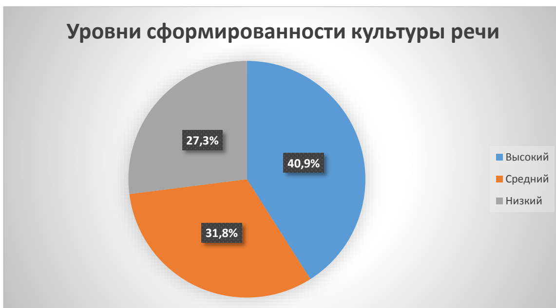
Рисунок 1 – Результаты констатирующего эксперимента по выявлению уровня сформированности культуры речи среди младших школьников